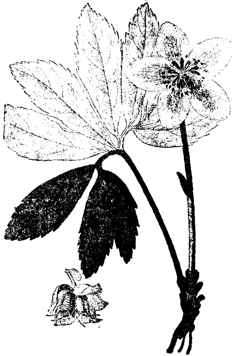
SPÂNZ ( Helleborus niger ) crește în Europa centrală

Spânz adevărat numit în știință Helleborus Niger L. crește în pădurile din Europa centrală. Partea întrebuințată de această plantă este rădăcina, care are un gust amar, iute și este foarte iritantă. În medicină se întrebuințează.