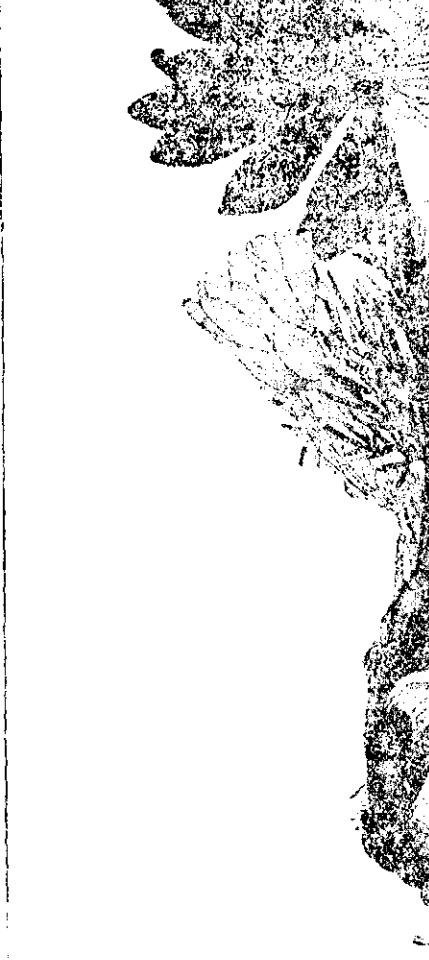
RUSCUȚĂ (Fânețe Jud. Ialomița)

Medicamentul este bun căci în părțile orientului (Rusia) se înlocuiește foile de Digitala în tratamentul boalelor de inimă cu ierba (Herba) de Adonis fiind mai credincioasă și nu dă loc la complicații ca Digitala (Pharmacopea Rusă 1913). Cantitate de iarbă fiartă și luată odată este de 0.80 centigrame la %, iar în 24 ore de 10 (zece) gr.