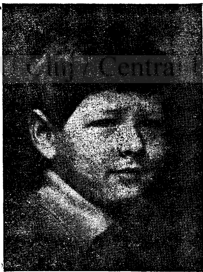
M. S. Regele Mihai I