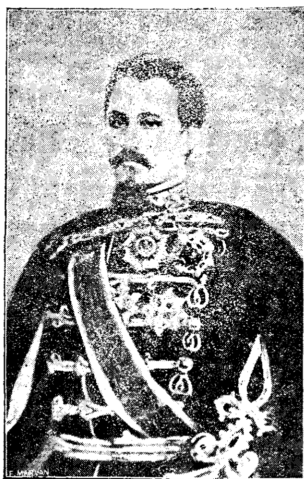
Domnitorul Alexandru I. Cuza (Unirea [Principatelor Române])