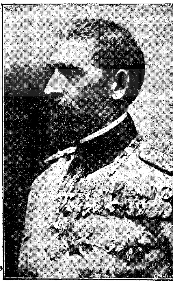
Regele Ferdinand I. (Făuritorul României Intregite)