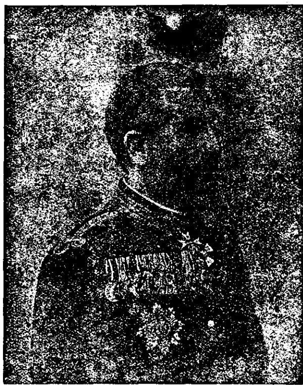
Regele Carol I (Independența României)