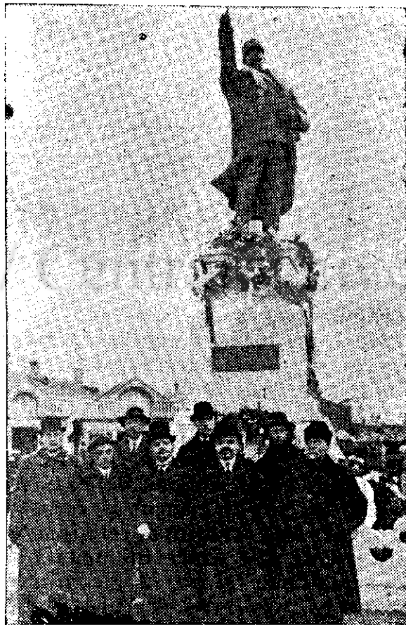
Generalul ST. POETAS