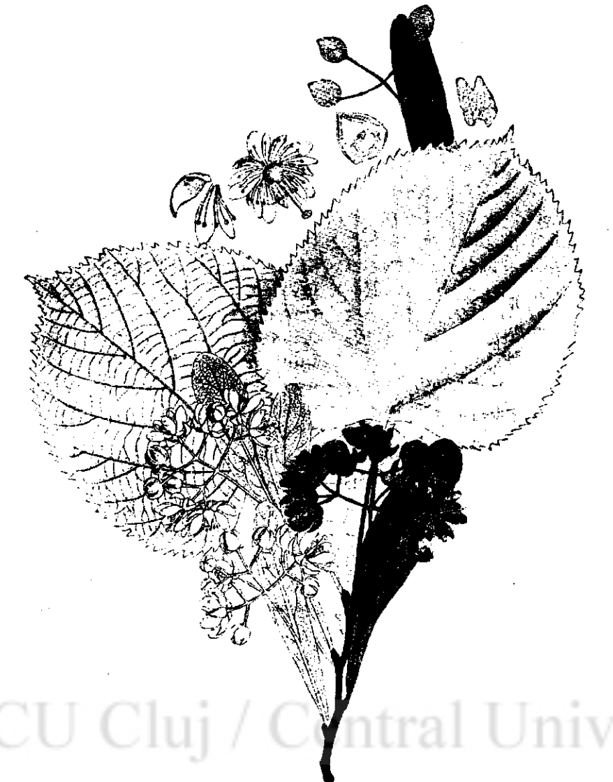
Tei cu frunză păsoasă (TEI ALB)

farmacii și drogherii. Pentru acestea oricine poate strânge toate felurile de plante, iar pentru vânzare nu va strânge de cât acele feluri, care se găsesc în acea localitate, în cantități mari și dintre acelea ce sunt mai căutate.