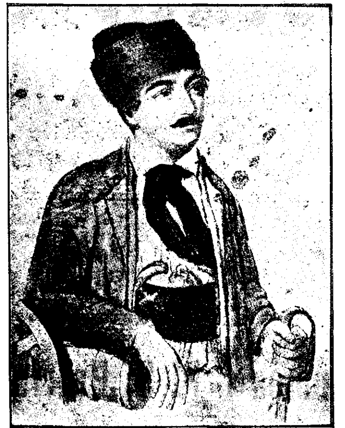
Eroul AVRAM IANCU