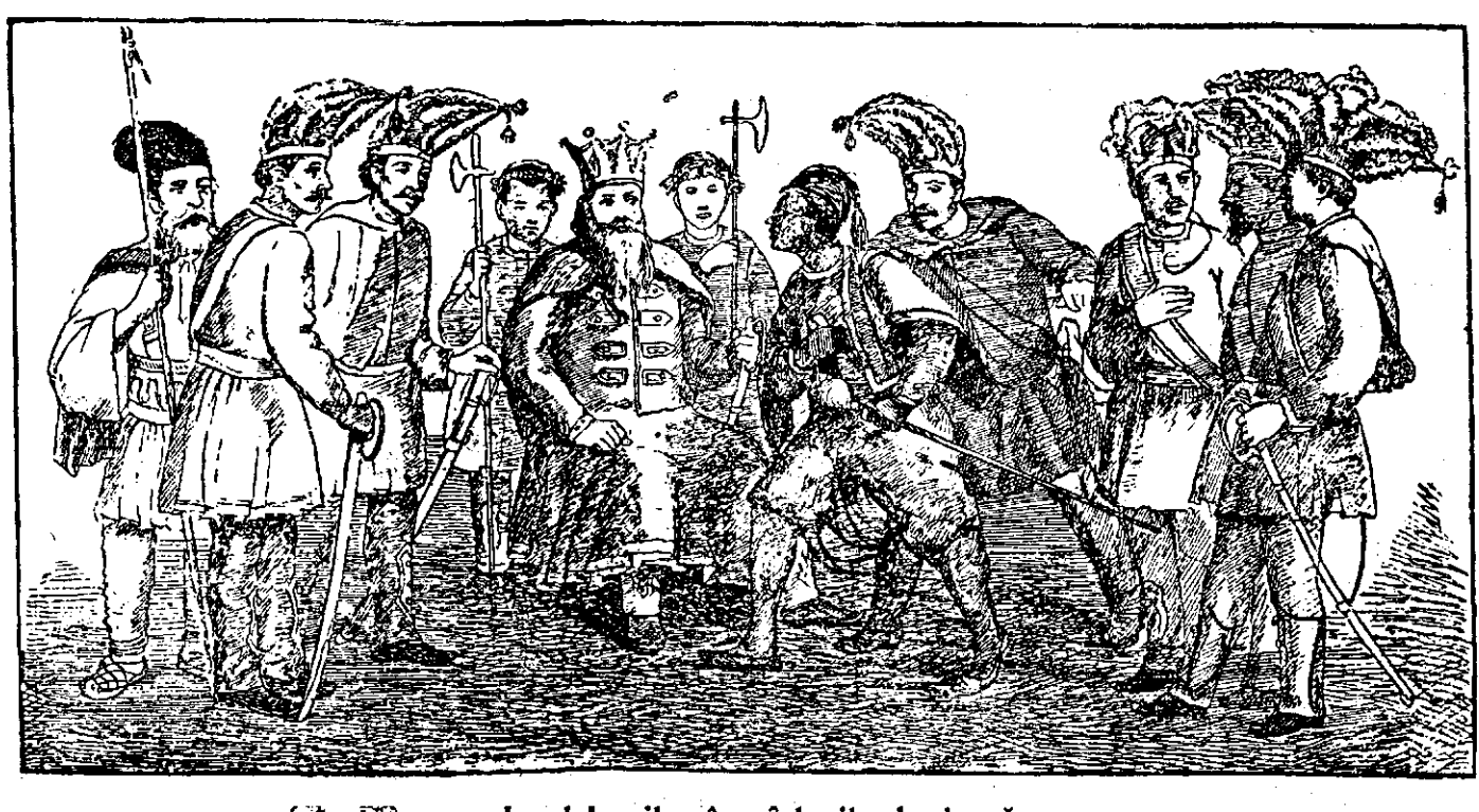
Jocul Irozilo: în cășlegile de iarnă

din regiunea muntoasă a județului nostru și-au câștigat de multă vreme o faimă binemeritată. Avem și o stațiune balneară, fără echivalent în țara noastră, lacul Căineni. Nămolul acestui lac, extrem de bogat în iod și alte săruri, precum și în radium, are un efect leucitor care întrece cu mult, după părerea celor mai autorizați experți, chiar efectele curative ale nămolului dela Tekirghiol. Ce păcat, însă, că nimeni până azi nu s'a gândit să organizeze cum trebuie această stațiune, care se află într-o stare destul de primitivă. Se poate presupune cu mult temei că există bogate zăcăminte de petrol în regiunea muntelui. Prezența din beșug a sării ar fi un prețios indicu. Numeroase localități și ape din județ își au numele legate de faptul existenței acestui mineral, ca, de ex.: Sărite, Sărățelul, Dealu Sării, Sărutești, etc., ba chiar numele râului principal al județului este Râmnicu-Sărat. Bineînțeles că mai e nevoie și de prezența unor alte fenomene geologice: anticlinale, sinclinale, etc... Dar aceasta-i treabă de geologi! Noi am expus o scurtă imagine a vieții economice actuale a vechiului județ muntenesc: Slam-Râmnicul. Victor Dimitriu.