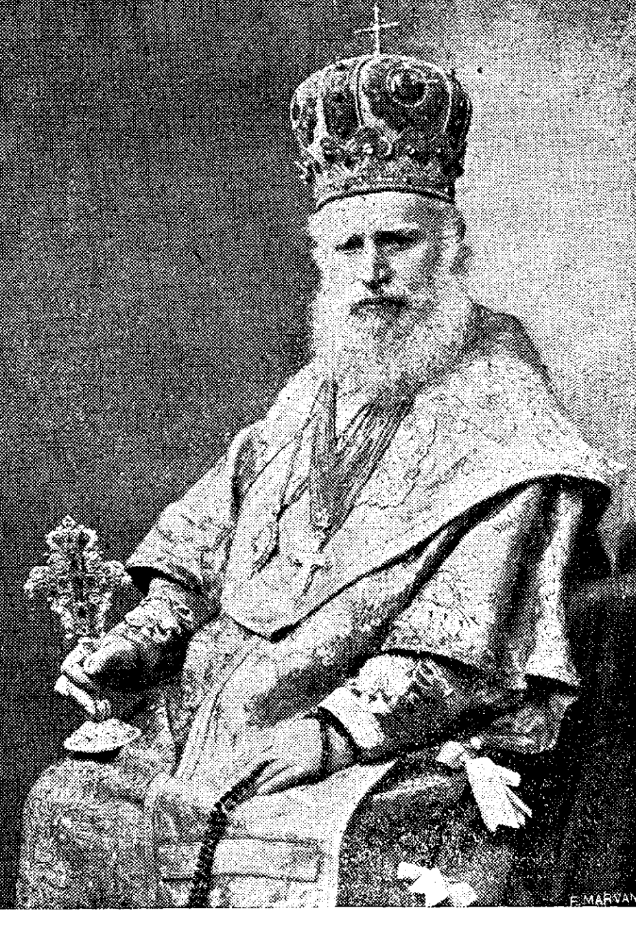
I. P. S. Sa Mitropolitul VLADIMIR al Bucovinei, decedat în 26 Aprilie 1926 la Cernăuți.