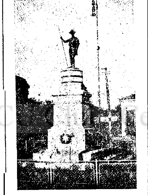
Monumentul cercetașilor din Tecuci

La un colț, o cruce înaltă se ridică deasupra unui caruc întins, acoperit, cu iarbă deasă: e groapa