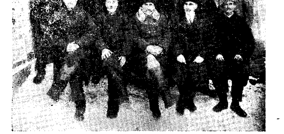
COMITETUL BĂNCEI POPULARE „DUMBRAVA”

Cu toată eriza de numerar, conducătorii acestei bănei, au făcut față tuturor cererilor pentru cumpărări de vite, unele agricole, se-