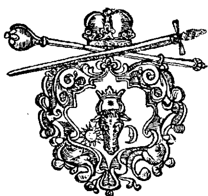
STEMA LUI ȘTEFAN XI, PETRICEȘTI-CU-VOCA, DIN 1673.