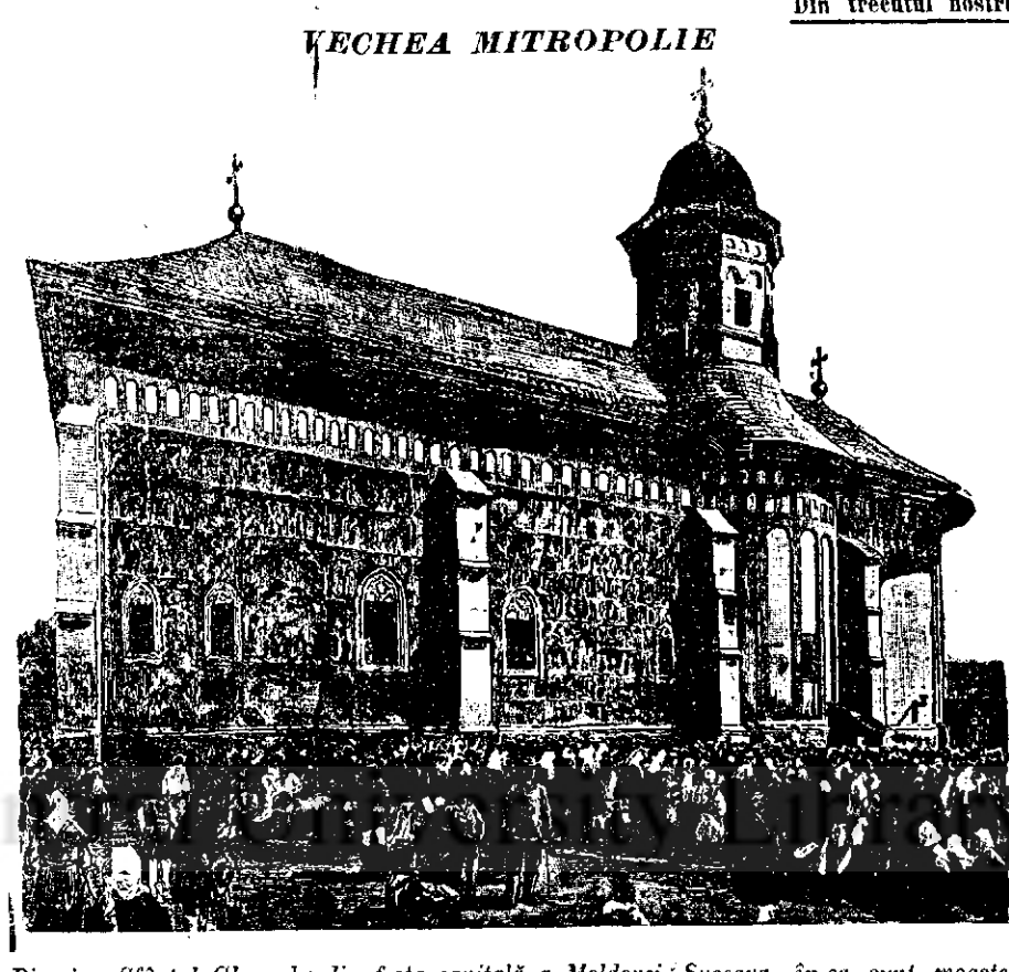
Biserica Sfântul Gheorghe din fosta capitală a Moldovei. Succesa în ea sunt moaștele Sf. Ioan cel nou. Biserica începută de Bogdan la 1514 și terminată de fiul său Ștefan-cel-tânăr la 1522.

jitoarelor și în descăntece, neascultarea de sfatul medicului și fuga de spital, sunt cauzele de seamă, pentru care mor atâția copii în țara noastră. E vremea să ne desmetoim cu toții, din întunericul în care am trăit până acum, să vedem bine pericolul și să dăm cu toții o mână de ajutor la îndepărtarea lui. Statul și-a făcut datoria, cât a putut și și-o face în continuare, dând spitale, medică, moașe, cari să ajute pe mame să salveze viața copiilor. E datoria tuturor cetățenilor să dea și ei, fiecare ce pot, ca să înălțăm acest mare pericol. Și ajutorul îl poate da fiecare, unui dând bani, alții sfaturi și cei ce nu pot da nimic să asculte ceace le spun cei ce cunosc aceste lucruri. Nădăduim că vor fi mulți care să-și plece urechile la plânsulele mameilor care și pierd copii. Credeți că în această țară, înzestrată cu minți luminate și inimi bune, se vor găsi destui cetățeni cari să se gândească la această chestiune însemnată. Dr. I. GLĂVAN Asistent la Facultatea de Medicină din Cluj. Din trecutul nostru