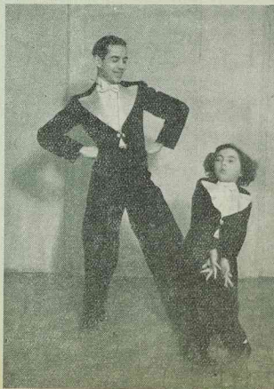
Duo Pleth and Lence

Színház után nézze meg a Regal bár műsorát!