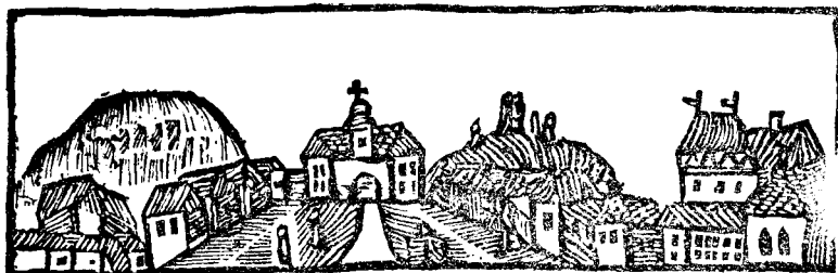
Blajul cel vechiu