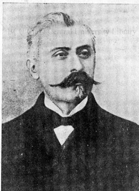
SPIRU C. HARET

NUMĂR ÎNCHINAT MEMORIEI MARE- LUI PEDAGOG NAȚIONAL SPIRU C. HARET