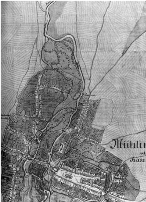
BILD 2. Stadtplan Mühlbachs vom Jahre 1769

Schriftliche Quellen. Die kartographischen Quellen wurden mit den von fremden Reisenden gelieferten schriftlichen Quellen ergänzt, andererseits ergänzten sie auch die gelieferten schriftlichen Quellen. Um dieses Ziel zu erreichen, habe ich die schon veröffentlichten und analysierten Reisebeschreibungen Siebenbürgens des 18. Jahrhunderts mit den kartographischen Quellen verglichen und analysiert, nämlich die Art und Weise, wie sich die schriftlichen Quellen und die kartographischen Quellen gegenseitig ergänzen.