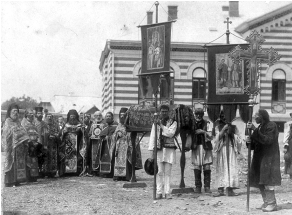
Abb. 6. Sanzenfeier in Suczawa. Prozession mit den Reliquien des Hl. JOHANNES NOVI, um 1898. Photographische Studie, vgl. Kronprinzenwerk, Band Bukowina, 1899, S. 225.

Selbst während des Ersten Weltkrieges änderte sich diese Haltung nicht grundsätzlich, wie der obige Textausschnitt zeigt. Allerdings mussten die Reliquien vor den heranrückenden russischen Truppen in Sicherheit gebracht werden. Auf Beschluss der Wiener Regierung evakuierte man die sterblichen Überreste im Herbst 1914 in einem bewachten Sondertransport über Dorna Watra (rum. Vatra Dornei) und Ungarn in die Reichshauptstadt, wo sie bis zum 25. Juli 1918 in der griechisch-orientalischen Kapelle in der Löwelstraße 8 51 eine „Zufluchtstätte vor den Zwischenfällen des Krieges“ fanden. 52 Nach einem feierlichen Te Deum in der Kapelle durch den anwesenden Metropoliten Wladimir v. Repta begann die „Heimreise“ des Hl. Ioannes Novi in die Bu-