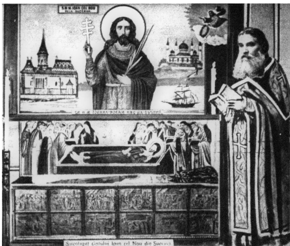
Abb. 7. Ein Heiliger des Ostens. JOANNES NOVUS aus Suczawa in Wien: Eine Ansicht des Heiligen, seines Sarkophags und des ihn bewachenden Mönches SIDOROVITSCH. Bericht und Bild einer Wiener Zeitung aus dem Jahre 1914. Wiener Bilder Nr. 43 v. 25. Okt. 1914, S. 6 u. 11.

Selbst während des Ersten Weltkrieges änderte sich diese Haltung nicht grundsätzlich, wie der obige Textausschnitt zeigt. Allerdings mussten die Reliquien vor den heranrückenden russischen Truppen in Sicherheit gebracht werden. Auf Beschluss der Wiener Regierung evakuierte man die sterblichen Überreste im Herbst 1914 in einem bewachten Sondertransport über Dorna Watra (rum. Vatra Dornei) und Ungarn in die Reichshauptstadt, wo sie bis zum 25. Juli 1918 in der griechisch-orientalischen Kapelle in der Löwelstraße 8 51 eine „Zufluchtstätte vor den Zwischenfällen des Krieges“ fanden. 52 Nach einem feierlichen Te Deum in der Kapelle durch den anwesenden Metropoliten Wladimir v. Repta begann die „Heimreise“ des Hl. Ioannes Novi in die Bu-