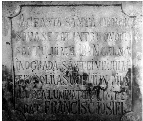
ABB. 4, 5. Kreuz zu Ehren von IOANNES NOVI im Kloster von Suczawa, errichtet 1882 unter der Regierung von Kaiser FRANZ JOSEF I. (Detail). Aufnahme K. SCHARR, Juli 2017.