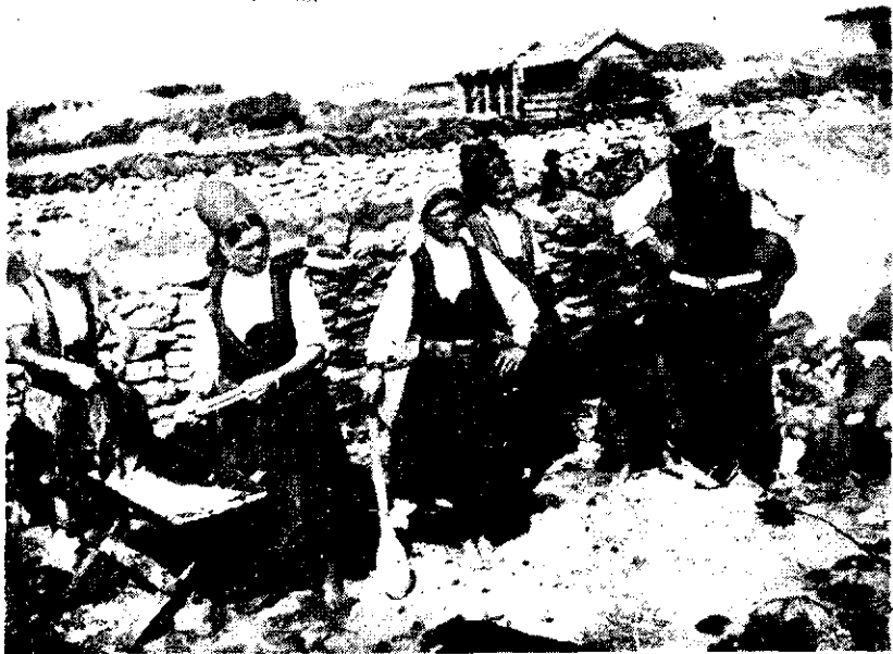
O familie de macedoneni la lucru în gospodărie.

Tânărul macedonean istorisea obiceiurile strămoșești cu multă căldură și putere de evocare. Mă răpise cu totul armonia glasului său. Părea un cântec lung pe care-l glăsuia cu ochii neconștient fixați, când în zarea de smaragd, când printre pietrele albe ale cetății.