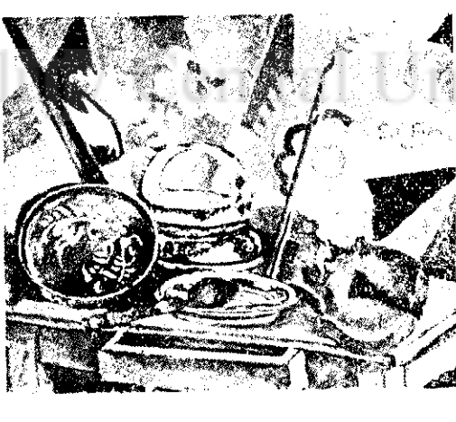
P. N. TUDOR Natură moartă