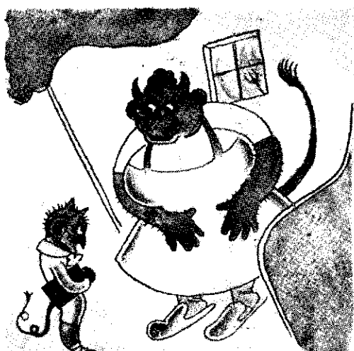
— Și dacă iai notă bună la germană, te duc să vezi pe Faust în cazanul cu smoală.