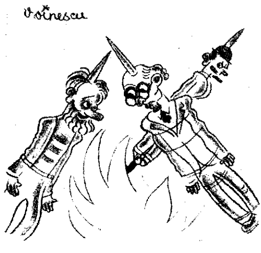
— Și, inchipuește-ți, domnule, că de câte ori spuneam pe pământ că sunt pui de găină, imbecilii mă băgau la belamnie!