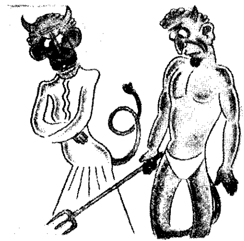
E.A.: — Dacă mai affu ca ieri, că ai seos pe Cleopatra din frigare și ai condus-o la toaletă, totu' s'a sfârșit între noi.