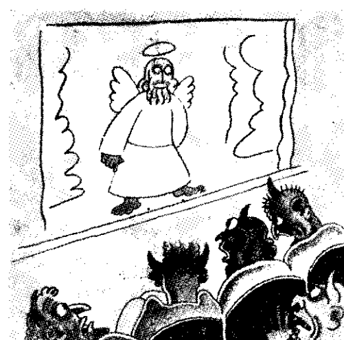
Soenă de teroare.