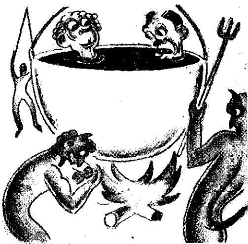
— Am impresia că ne-am mai cunoscut pe pământ, și încă tot la băi...