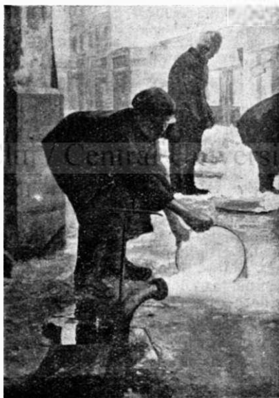
G. CATARGI: În Ianuarie.

Ceeace însă isbește pe vizitatorii expoziției pictorului Triester sunt desenele în general, portretele în deosebi. „Biserica Sf. Antim”, „Grădina Icoanei”, „Cap de studiu” și mai cu osebire „Nud-studiu”, îl așează pe expo-