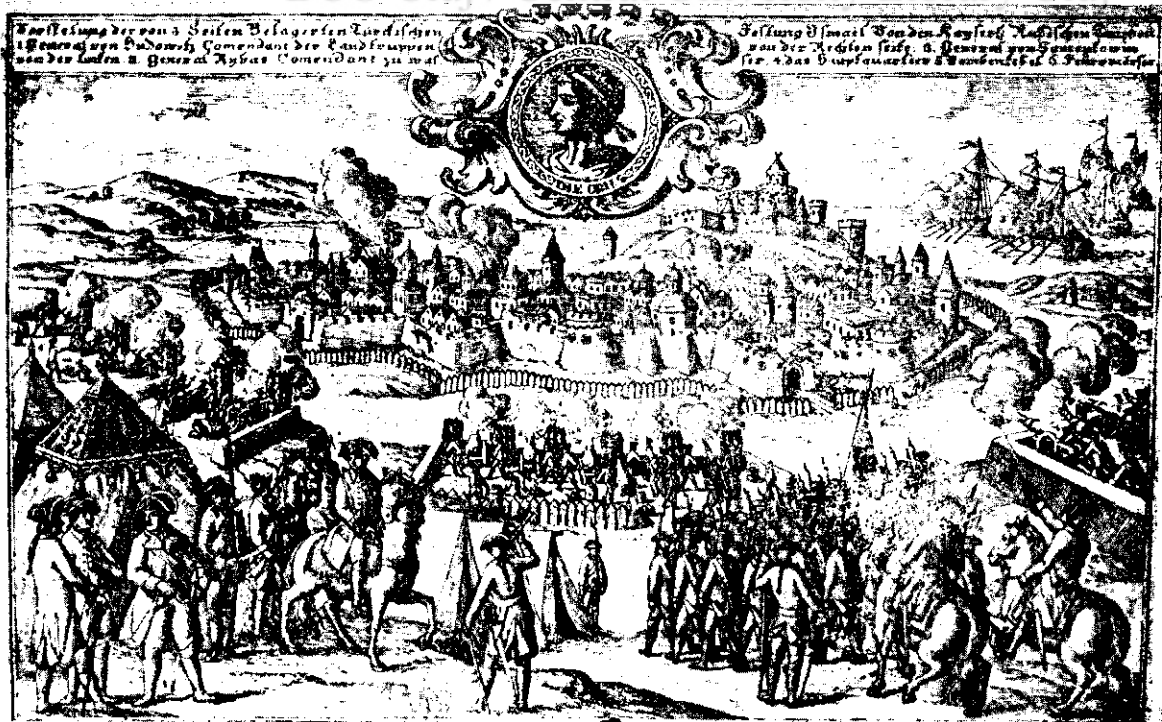
Cetatea Ismail atacată de către trupele rusești.