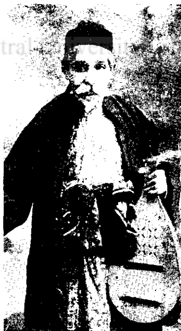
...în Barbu Lăutarul

Toți adevărații pretendenți ai artei, precum și bătrânii actori consacrați până atunci, vin serile, să se împărtășească din bogăția scânteietoare a vervei lui.