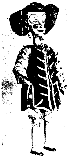
VRAJITORUL COLAS din opera „Bastien și Bastienne”, de Mozart

și seara la ora 8, spectacolul se va repeta cu programul de deschidere.