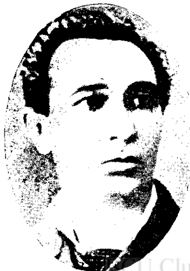
I. Anestin la 25 de ani

În galeria de portrete ale măiestrilor teatrului românesc, se cuvine ca pașii noștri să se oprească cu aceea evlavie caracteristică respectului marilor figuri, în fața tabloului lui Anestin. Peste relieful, pe care, de mult, l-au prins liniile viguroase ale personalității marelui actor, praful uitării nu se va putea împături