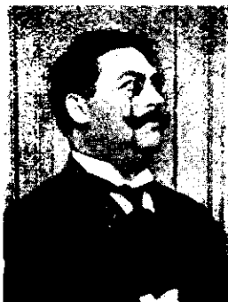
...in „Heidelbergul de uită dată”

Jubileul de 40 de ani, și l-a serbat tot în turneu cu „Nerone” de Pietro Cossa. În 1921 a deschis stagiunea teatrului Na-