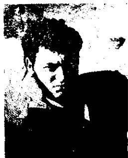
...and era in trupa lui Grigore Manolescu

Semna directorul cu piesa respinsă. De rândul astă ura și răzbunarea, învinșese. Stejarul fusese doborât. Și astăzi tocmai când teatrul avea mai multă nevoie de el, e scos la pensie fără să fi avut anii impliniți. Lovitura de trăznet! Și cum torni apă fiartă peste o floare, așa a fost lovit el sufletește de acea neînțeleptă răzbunare. Din ziua aceea și până când a murit n-a mai călcat piciorul lui pe scândura Naționalului.