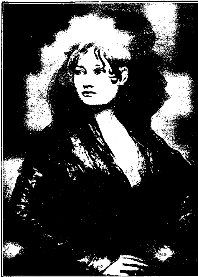
GOYA: ISABELLE COBOS DE PORCEL

Și pentru el era mișcare. El deosebitul omenesc, îl exaltă, îl intensifică până la sinteză. De aceea întrea-