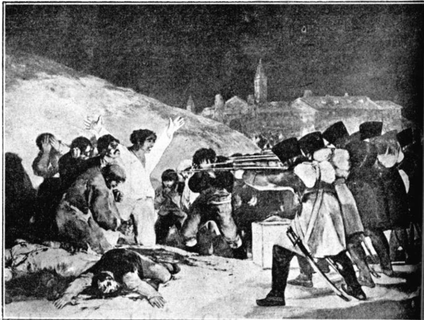
GOYA : SCENA DIN 3 MAI 1808

Goya, caüchemar plein des choses inconnues, De foetus qu'on fait cuire au milieu de sabbats..