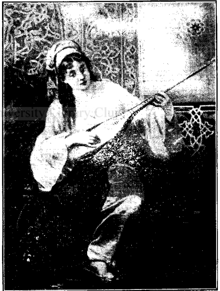
ORIENTALA: TH. AMAN.