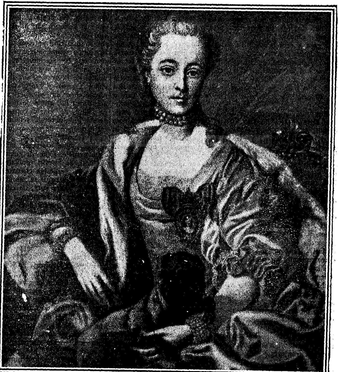
Princesa Ecaterina Gallitzine, născută Cantemir.

(Portret de Van Loo și gravat de R. Gaillard)