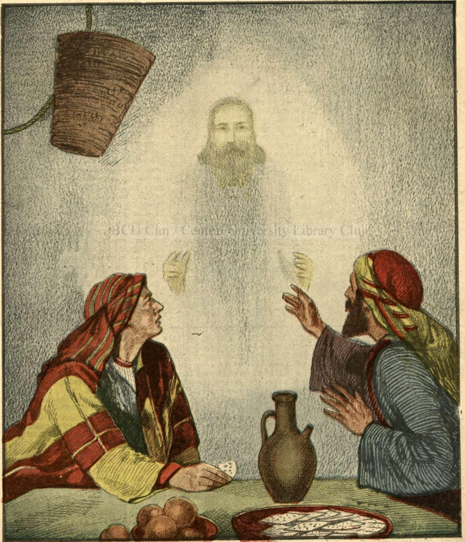
Apariția lui Cristos la Emaus. — (Vezi pag. 3).

PREȚUL ABONAMENTULUI în țară: pe un an 150 lei în străinătate pe un an 300 lei