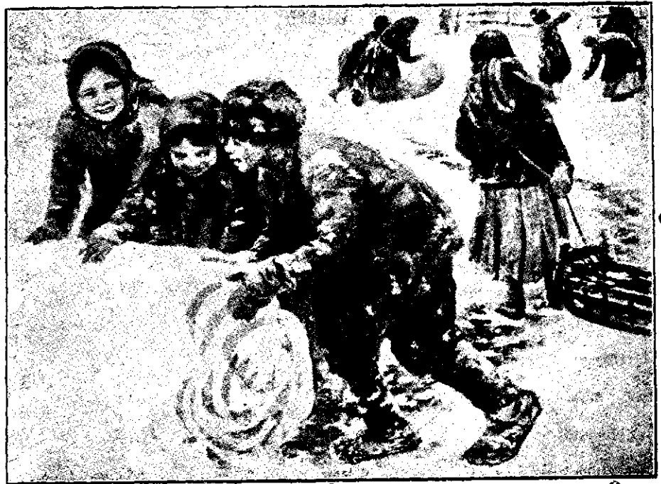
Iarna în sat. Copiii de țărani jucându-se cu zăpada. Tablou de Sicikov. (Vezi pag. 4-5).