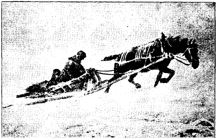
Prins de viscol în timpul iernei în câmp, tablou de Karazin

În schimb la țară iarna domnește zăpadă sau lăsându-se pe alunecuşul în toată libertatea ei. Aci, n'o poate dealurilor cu saniile lor de lemn