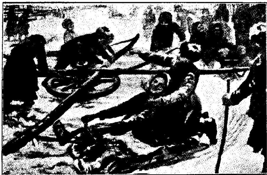
Iarna în sate: Copiii dându-se în sanie prins în roată. Tablou de pictorul Siciakov.

Am sunat imediat după ajutor și în timp ce servitoarea fu condusă în odaia ei, am întrebat ce se făcuse Brunton. Într'adevăr dânsul dispăruse. Patul lui era neatins și nimeni nu-l văzuse. Hainele, ceasul și chiar banii lui, au fost găsiți în odaia lui; numai fracul pe care îl purta de obicei lipsea de-asemena papucii lui li-