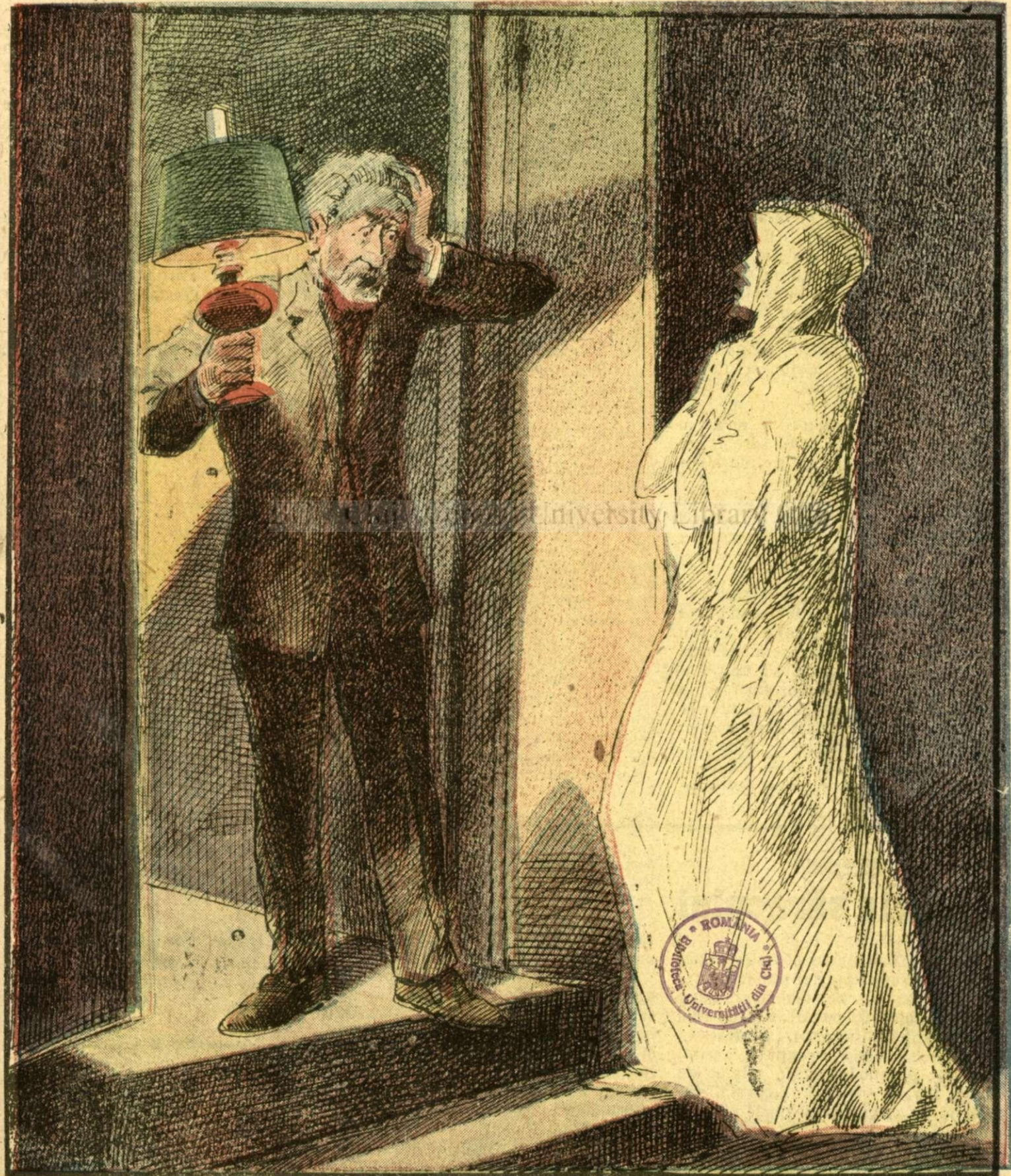
VEDENIA. — (Vezi explicația în pag. 6 și 7)

PREȚUL ABONAMENTULUI în țară: pe un an 100 lei. în străinătate pe un an 200 lei.