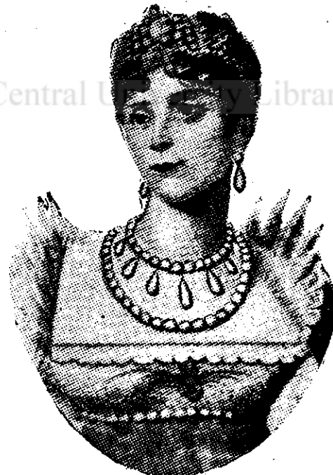
Impărăteasa Iosefina de Isabey, 1812