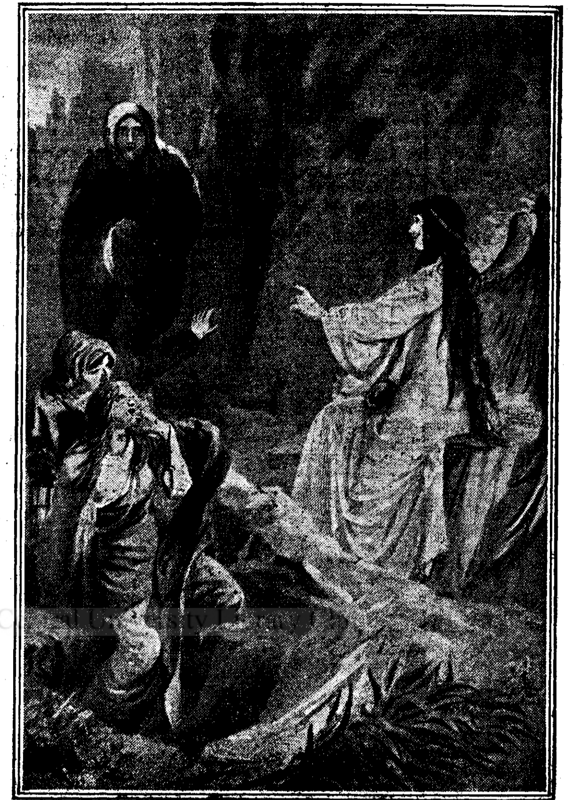
„El nu mai este aci: El a înviat”. (Tablou de Al. Zîca).

De atunci și până astăzi privim și primim cu atâta drag această floare ca și un simbol ce deschide drumul,