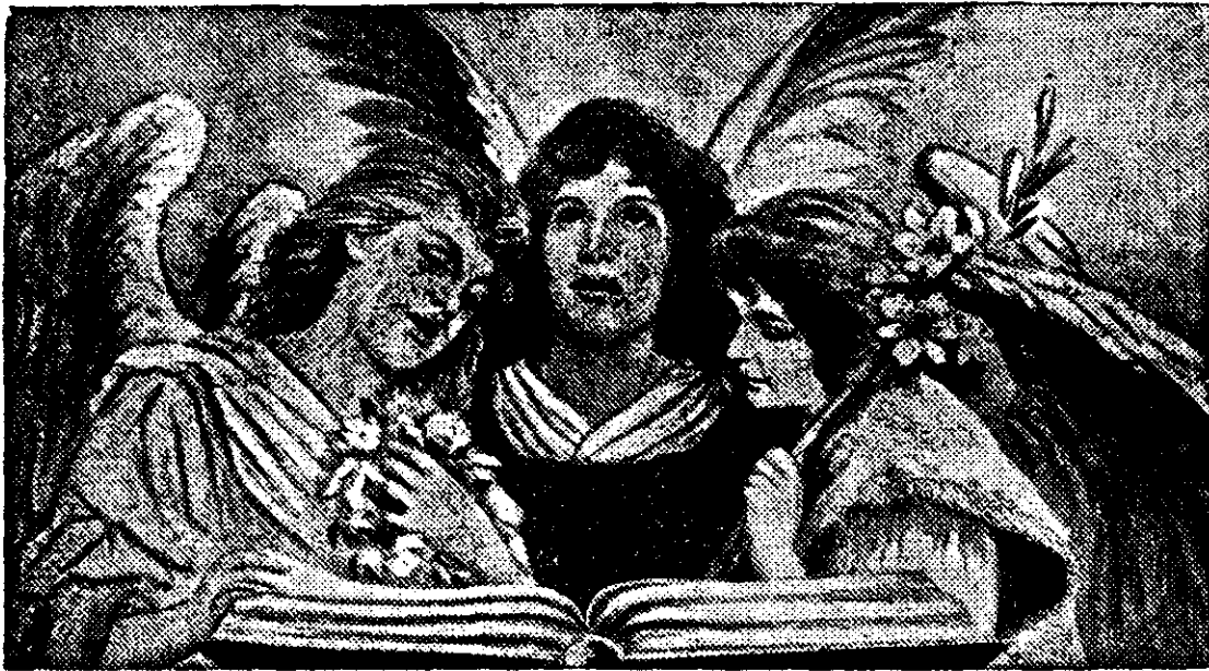
CANTECUL INVIERII. — Tablou de Max Ehler.