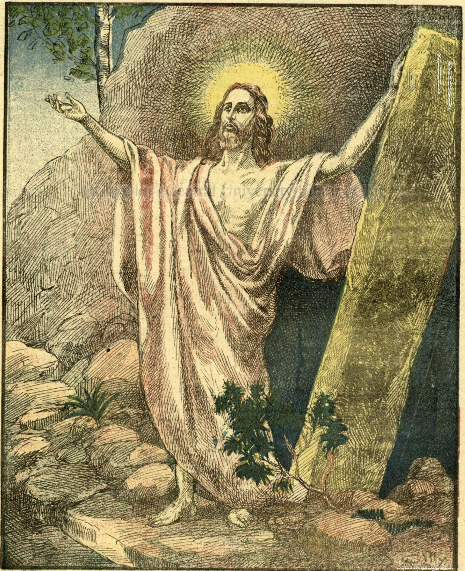
F. Doubec. — INVIEREA LUI CHRISTOS.

PREȚUL ABONAMENTULUI în țară: pe un an 100 lei. în străinătate pe un an 200 lei.