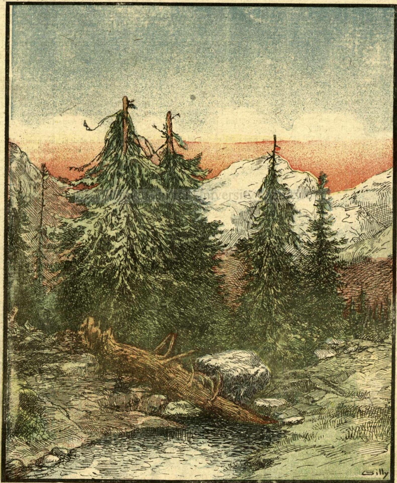
Piatra Caprei (munții Dornei).