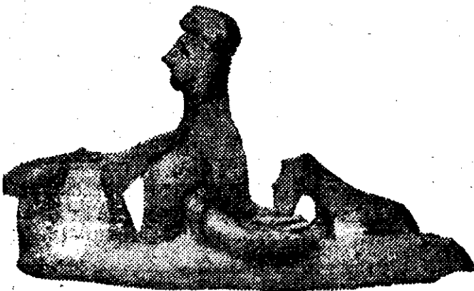
Evoluția sculpturii în Cipru. D. la cea dintâi înce care de s' a'ptur. și până la statuia Artemidei.

Ceeace face să se creadă că Ciprul este leagănul culturii este gradăția care se constată în dezvoltarea obiectelor găsite și care dovedește evoluția care s'a urmat dela formele cele mai rudimentare și până la cele mai perfecte și aceasta în toate domeniile atât artistice cât și economice. Sculptura, spre pildă, este reprezentată în toate stadiile evoluției sale, începând cu lucrări făcute în lut și care reprezintă animale sau figuri omenești oribil de nenaturale și terminându-se cu lucrări de artă ca statuia Artemidei, care pare a fi opera unor elevi a lui Praxiteles.