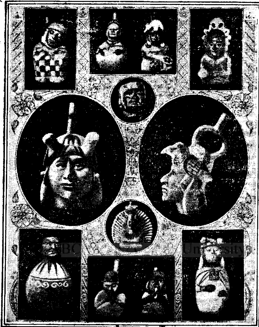
7000 de ani în urmă! Lucrări în ceramică și lut găsite în insula Cipru.

cute că cimitirul acesta are o vechime de 7000 de ani.