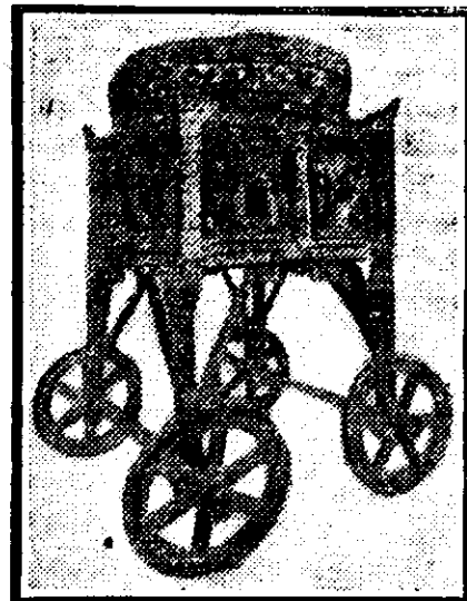
Căruțor-palator, lucrat 7000 de ani în urmă.

cele mai interesante sunt acelea cari par a fi scoase din textul bibliei. Așa este căruciorul-spălător, despre care se vorbește și în Cartea Impăraților, și care ar fi aparținând împăratului Solomon. El este tot lucrat din bronz. Nu mai puțin interesante sunt, din punctul de vedere arheologic, și lucrările de lut, dintre care reproducem unele exemplare.