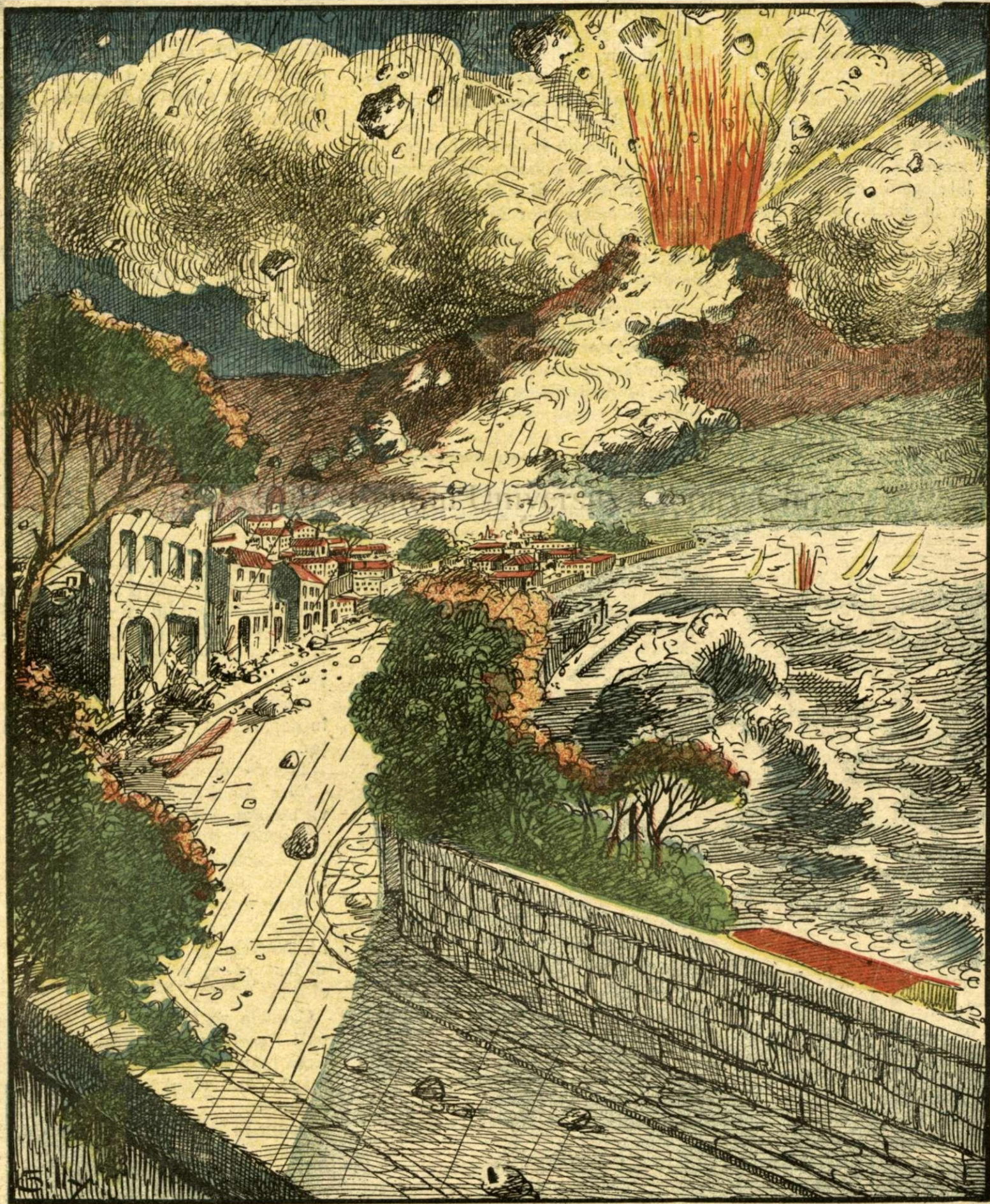
Groaznică erupție a vulcanului Etna.