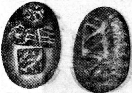
Cea mai veche monedă din lume.

Muzeul din Londra posedă cea mai veche monedă din câte au existat. Ea are forma unui ou turtit, după cum se vede în clișeu alăturat. Pe o latură este reprezentat un animal cu capul aplecat, care pare că