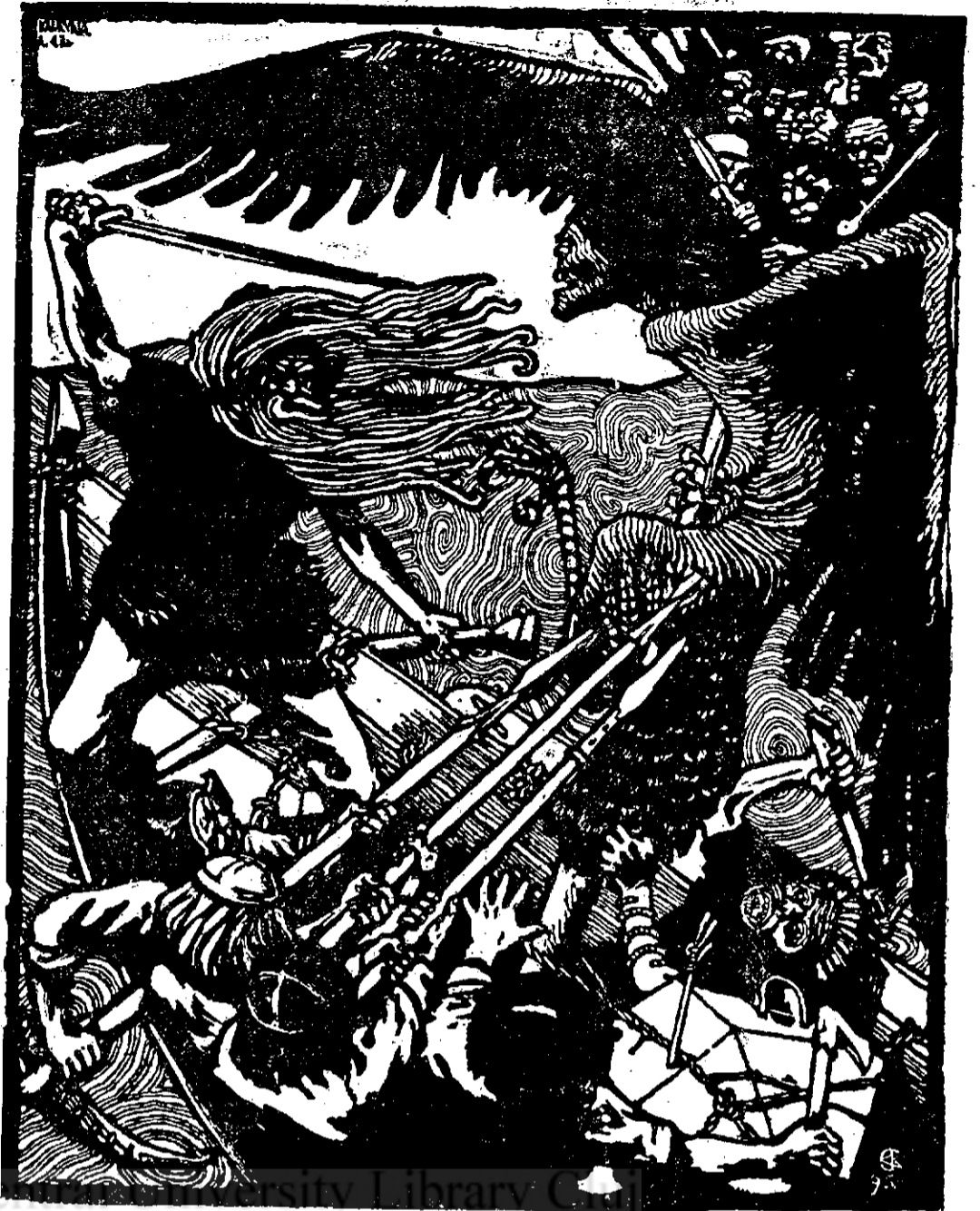
A. Gallen: O ilustrație din Kalevala.

este un adevărat titan. La început el a fost un realist și însăși Kalevala era privită de el din punct de vedere realist. Dar cu cât s'a dezvoltat mai