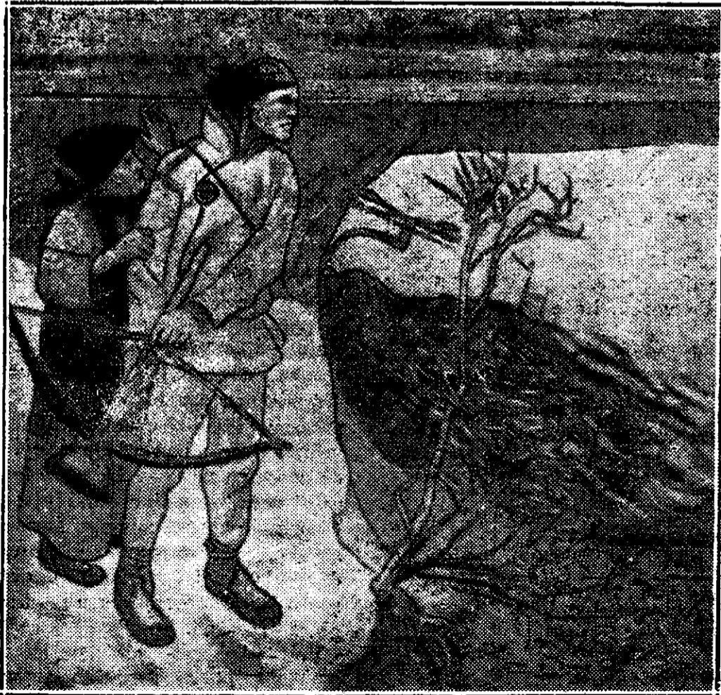
A. Gallen: Războarea lui Jucahainen din Kalevala.