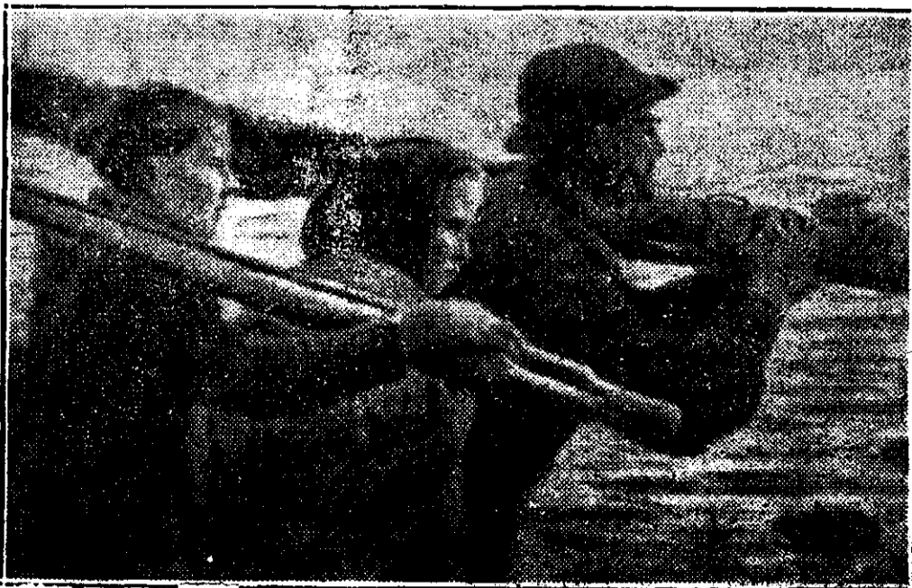
Edelfelt : Pescarii.

Lucrările lui Edelfelt de și păstrează numele culturii apusene au însă pecetea inspirației naționale și coloritul local. Frumos și plin de efect este tabloul lui „ Pescarii ” pe care îl reproducem și multe din peisagile