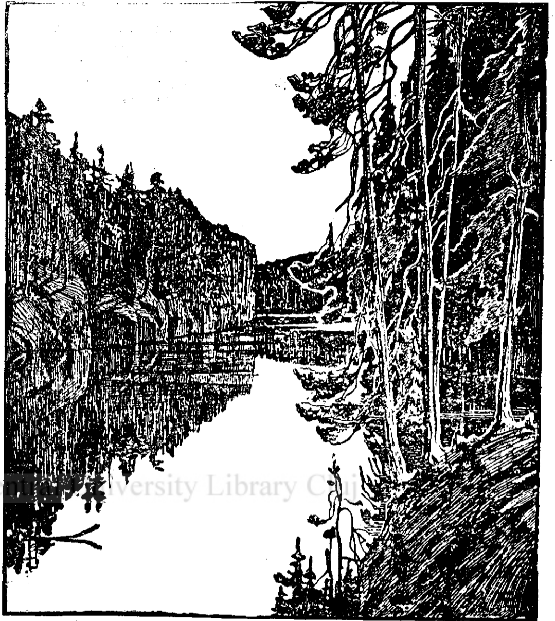
Edelfelt; Peisagiu fiinlandez

În locul școlii de bele arte Fiinlanda a avut pe Albert Edelfelt . Meritul acestui geniu național fiinlandez a fost mai ales în aceea ce el a pus bazele unei arte fiinlandeze independente și naționale. El a știut să unească în jurul său toate tinerile vârstare ale artei fiinlandeze și a fost