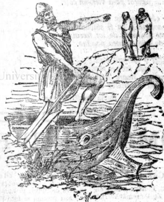
Fig. 5. Luntrașul Caron cerînd oboi dela umbrele morțitor

ton i se aducea sacrificiu în timpul nopții berbeci negrii cărora le puneau între coarne tîmbe aprinsă și aplecîndu-le capul la pămînt. Soldurile animaŃului erau în special consacrate Zeului. Pluton avea templu și la Roma, iar locuitorii din Syracuse sacrificau în onoarea lui în fiecare an 2 berbeci negrii aproape de fîntîna Cyana, unde răpise pe Proserpina. La început locuitorii din Latium îi sacrificau chizze oameni; dar jură înlocuții mai tîrziu cu tauri și berbeci negri totdeaceu în număr pereche,