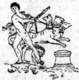
Fig. 6. Câinele Cerber păzitorul infernului înfrânt de Hercule.

nos bărbos, cu haină murdară și veșnic stând cu lopata în mână cerând tuturor un obol, (La siava), pe care dacă nu l'ar fi avut în lumea cealaltă pus în gură în momentul înmormântărei, nu erau primiți ci siliți să trăiască o sută de ani în pribegie. (Fig. 5).