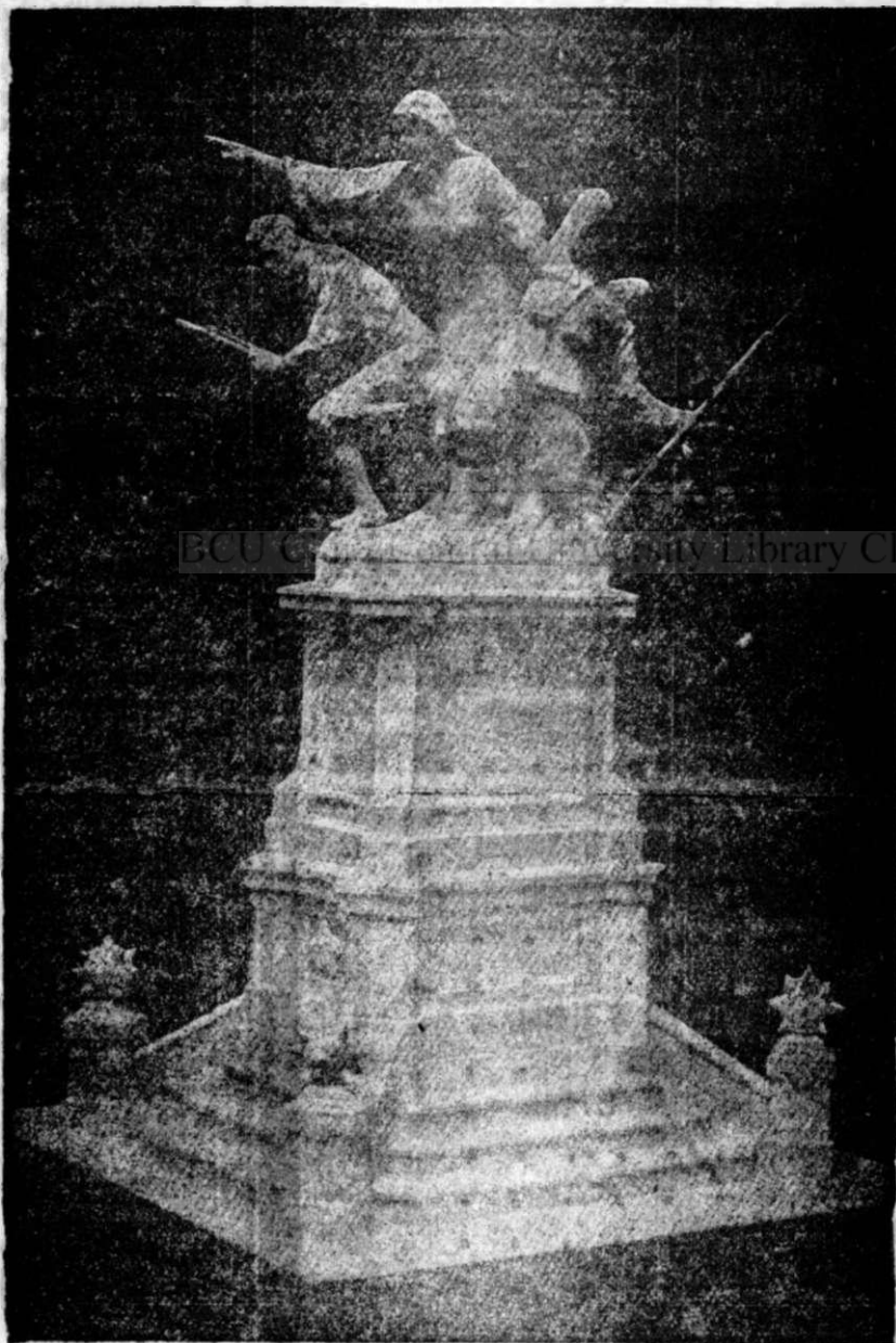
MONUMENTUL EROILOR DIN ODOBEȘTI