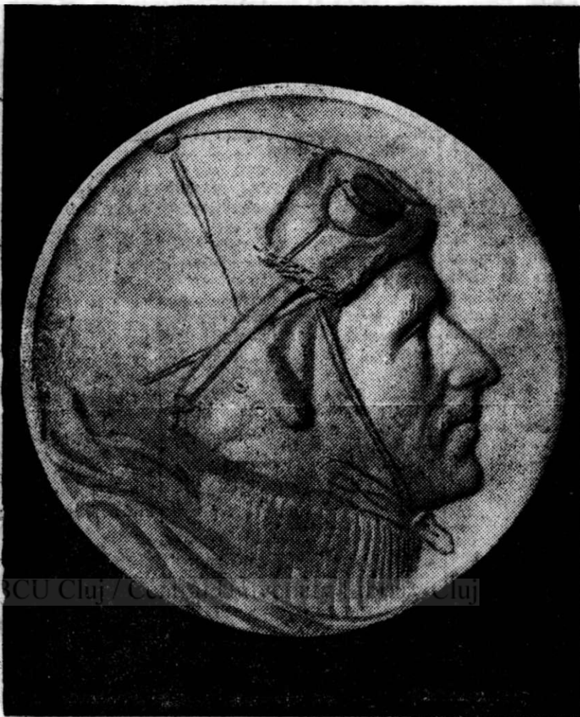
AUREL VLAICU BASO-RELIEF DE SCULPTORUL MATĂOANU