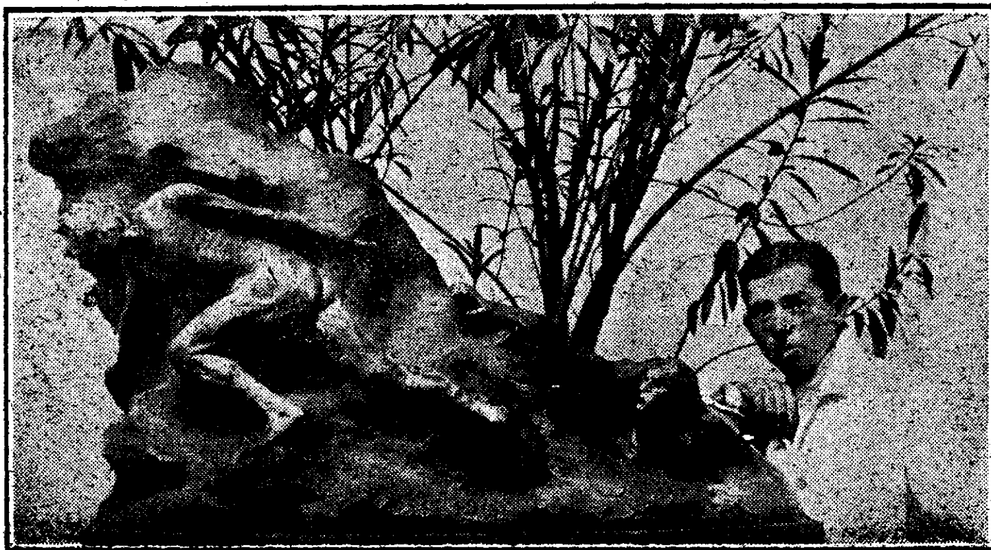
Meritează încercare de o execuție remarcabilă a cunoscutului și apreciatului sculptor THEODOR BURCĂ.