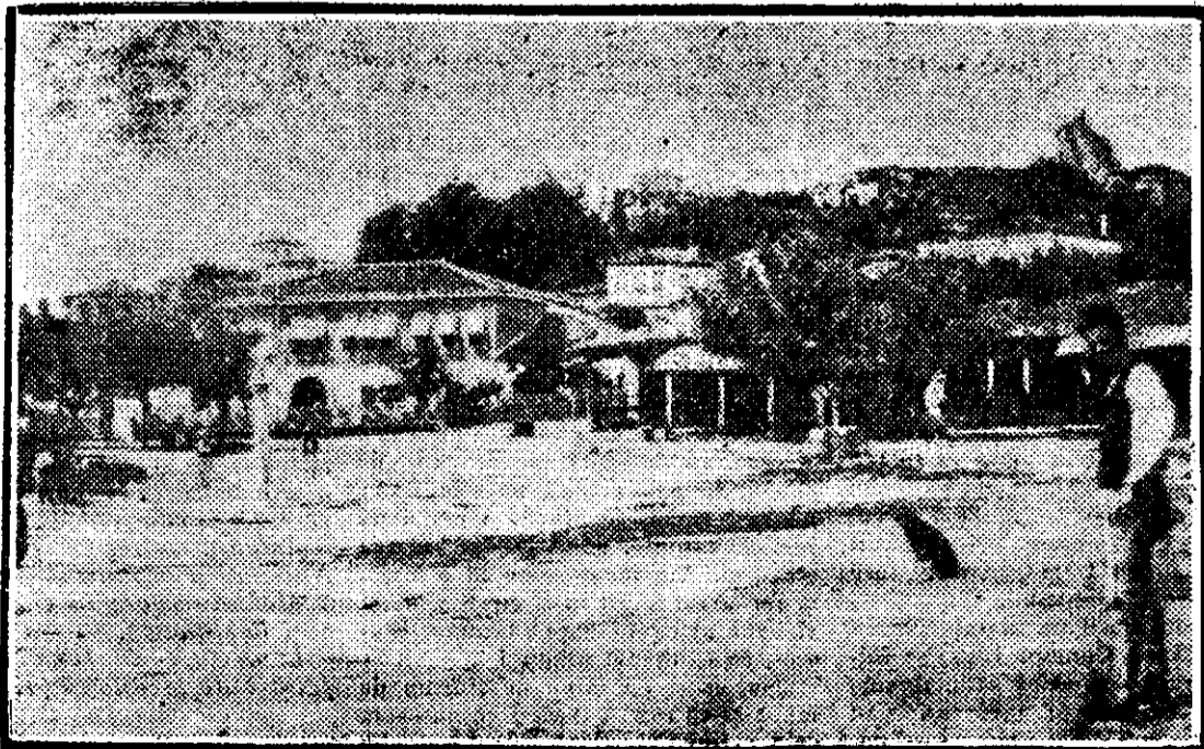
Piața orașului Durazzo