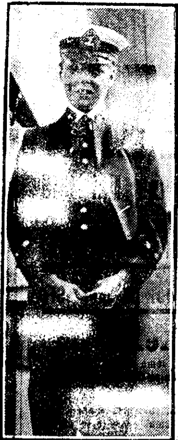
PRINTUL GALLILOR are se află pe frontul italian