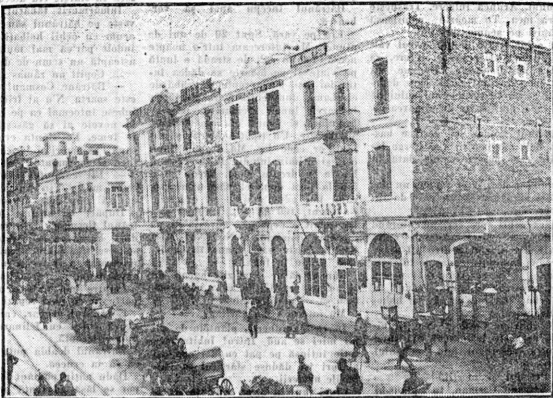
O stradă din Smirna