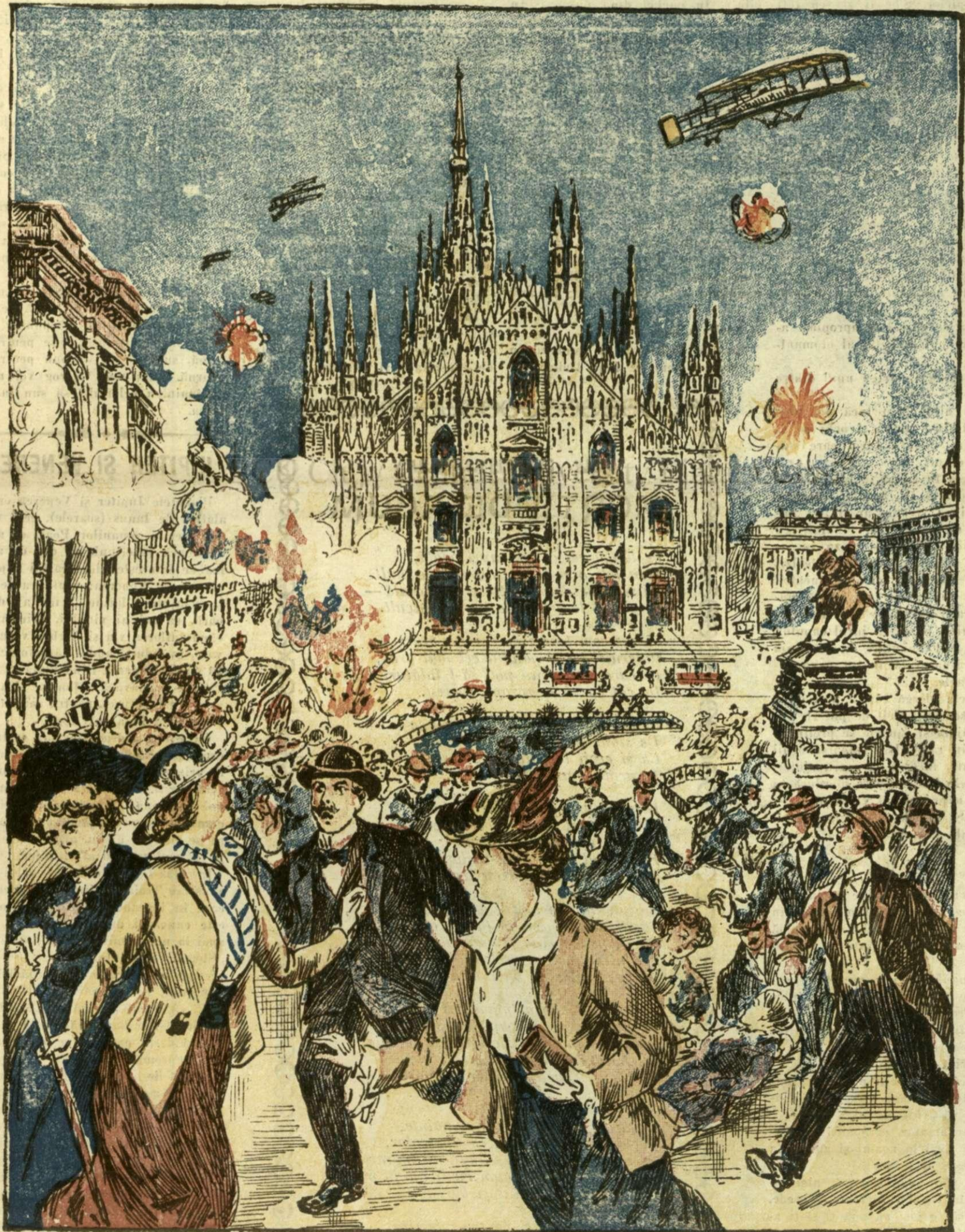
Bombardarea orașului Milano de către o escadrilă aeriană austriacă.