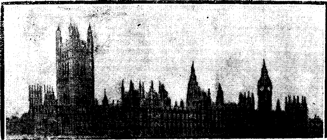
LONDRA. — Parlamentul englez.