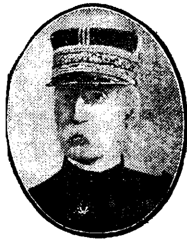
GENERALUL GALLIENI unul din șefii armatei franceze.