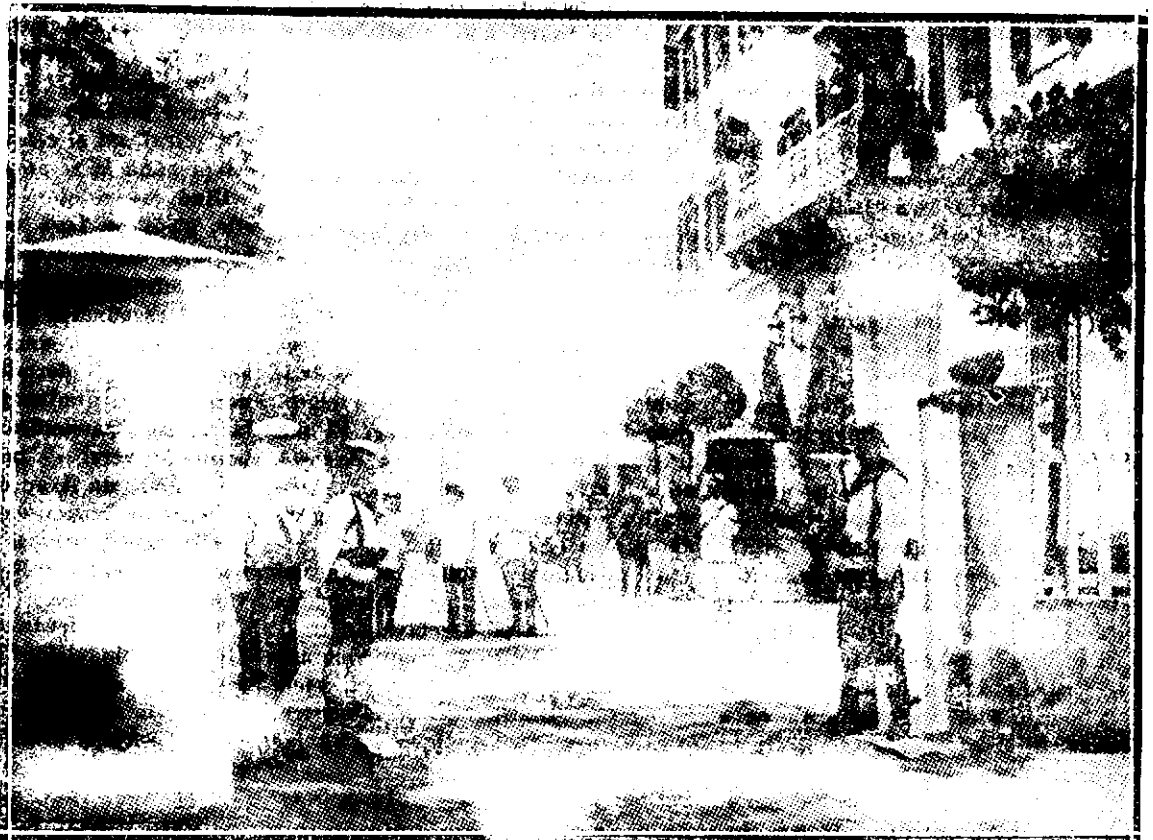
O stradă din Durazzo

„Doamne, iartă-le lor ceea ce fac, că nu știu ce fac!“.