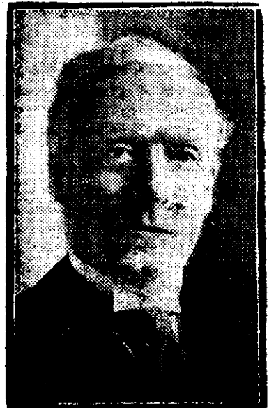
D. ASQUITH prim-ministru al Angliei