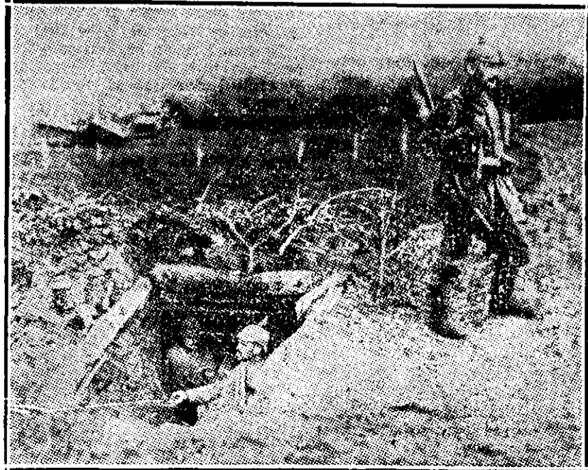
Intrarea unei tranșee germane

Vilegiatura trubadurilor noastre se anunță foarte interesantă. Vor fi sezători la cazinurile din Constanța și Sinaia, la Slănic și Călimănești, în creerii munților ca și la marginea mării... Bucureștenii se vor amuza ca și la București, indiferent dacă s'au dus pentru liniște sau pentru agrement. Numai dacă singuraticile Driade ale pădurilor de pe valea Oltului sau sălbăticile naiade de la Con-