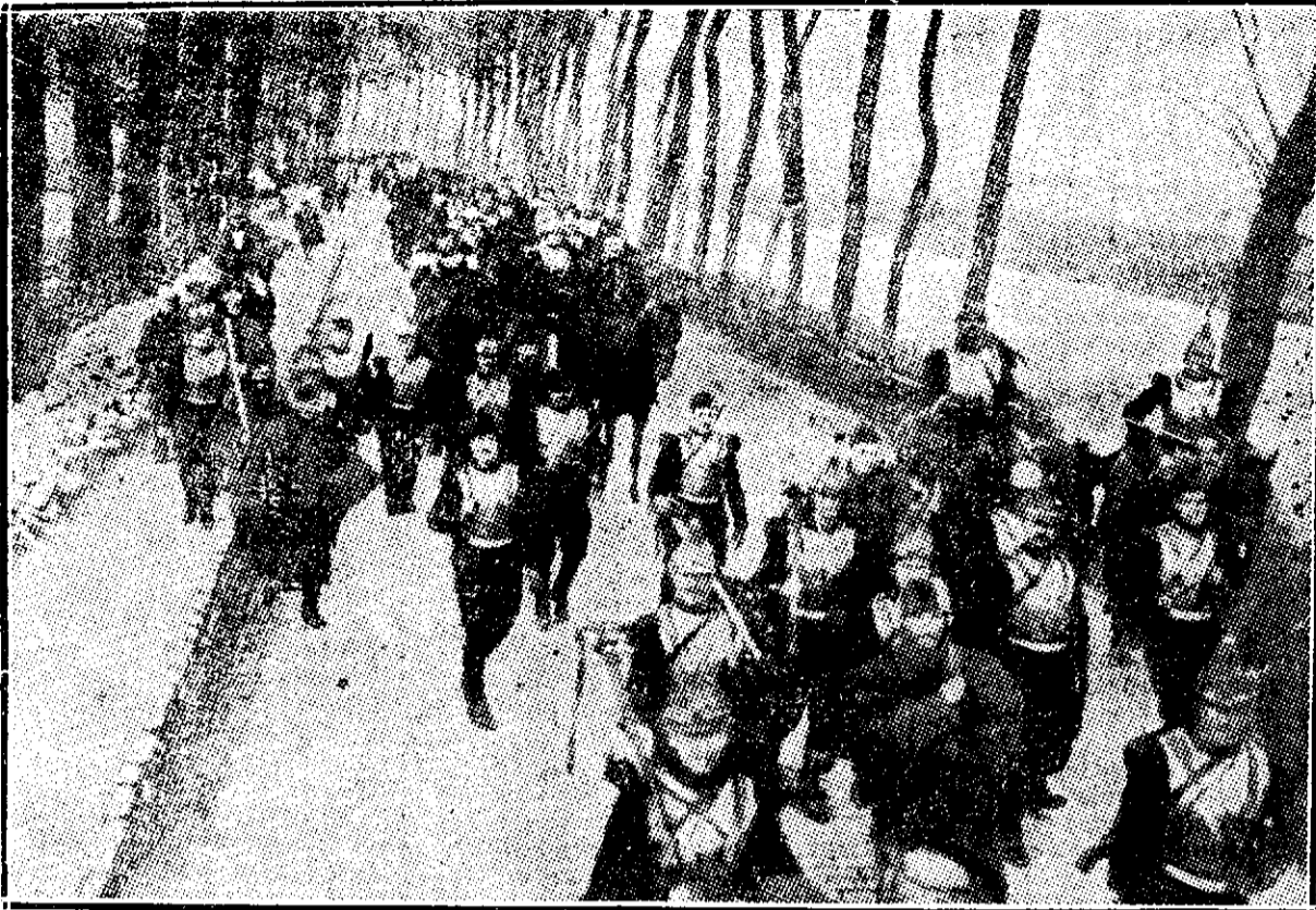
Detășament de cuirasieri francezi. In mers pe un drum din regiunea Yserului