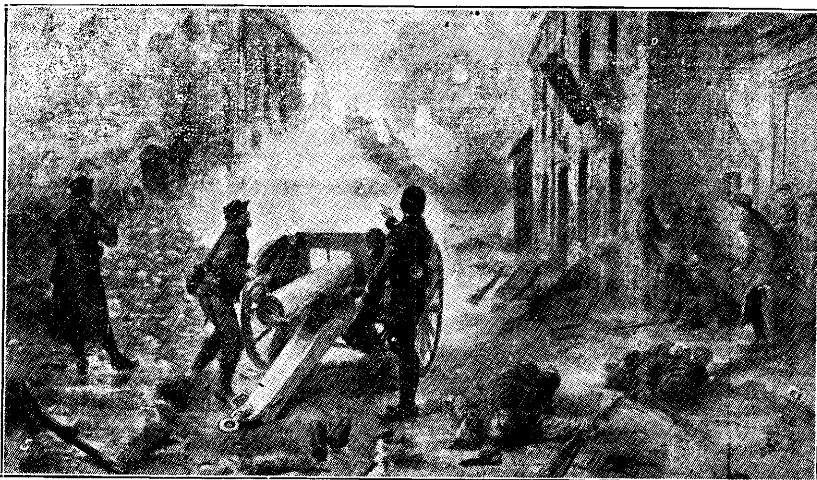
Sub focul unui tun francez 75

cațiunile de campanie. M. S. și-a exprimat dorința că și Crucea Roșie Română ar trebui să adopte esperanto.