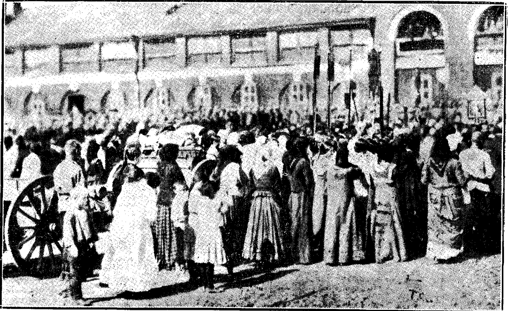
RUSIA. — Familiile celor cari pleacă în război

E interesant în privința deschiderii cerului, ce ne spune d. T. Pamfil: „... se vede întâi o dunghă albastră, după care urmează alta roșie, care-ți ia ochii; atunci începe să bată toaca 'n cer' ”.