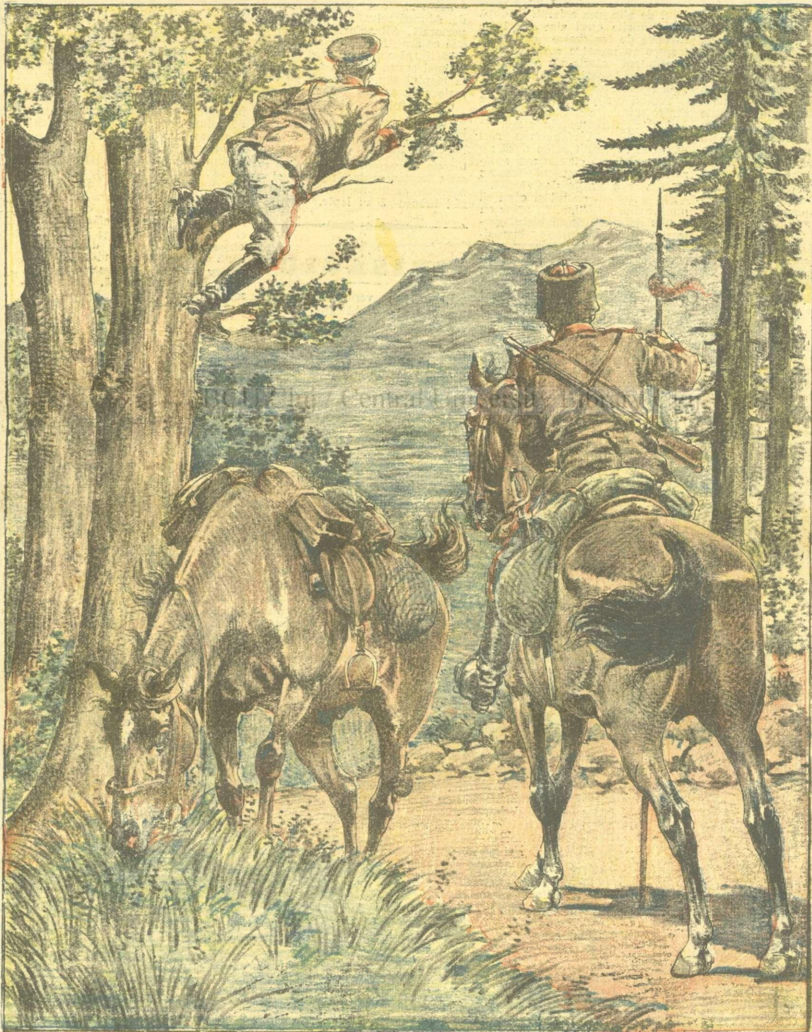
Sentinelă căzăcească la granița austriacă