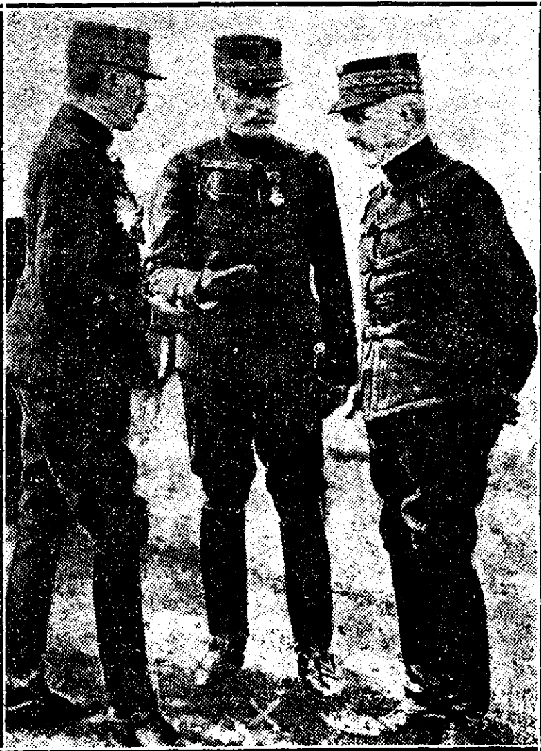
Generalul Dubois care a luat locul generalului Manoury, rănit mortal de germani

Dar mai presus de orice, ar trebui să mulțumesc acelor două persoane, că nu mi-am prăpădit ochii citind vre-o carte mai puțin interesantă decât conversația lor și am ajuns astfel la destinație, fără să știu când