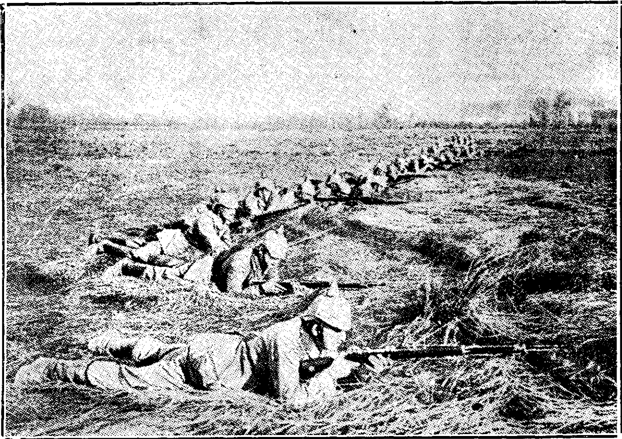
Infanteria germană așteptând semnalul de atac

Trecură câteva momente, când deodată s'auzi un răcnet scurt și o bufucală. Când se uită tartorița, văzu copilul întins pe jos sub