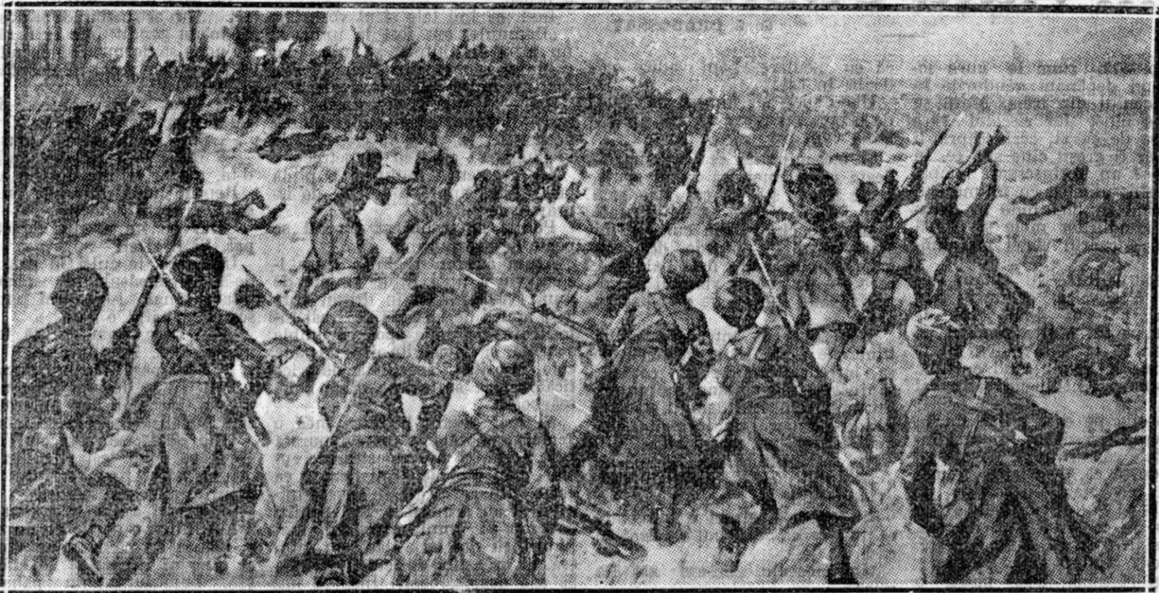
Indienii șarjează cu haioneta o coleră germană și o pun pe fugă