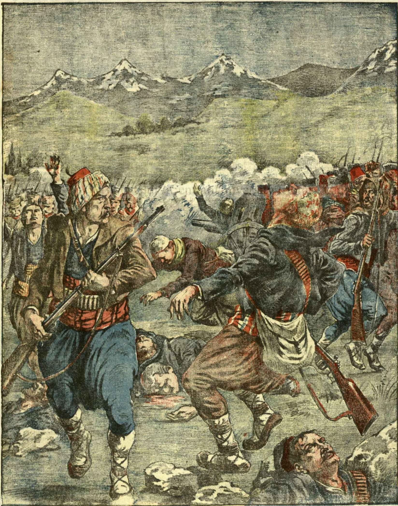
Ultima încăerare sângeroasă între comitagii bulgari și grăniceri sârbi

ANUNCIURI Linia pe pagina 7 și 8 — BANI 20 —