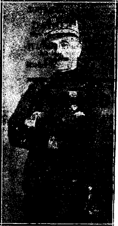
Generalul Foch, comandantul șef al armatelor franceze de la Nord