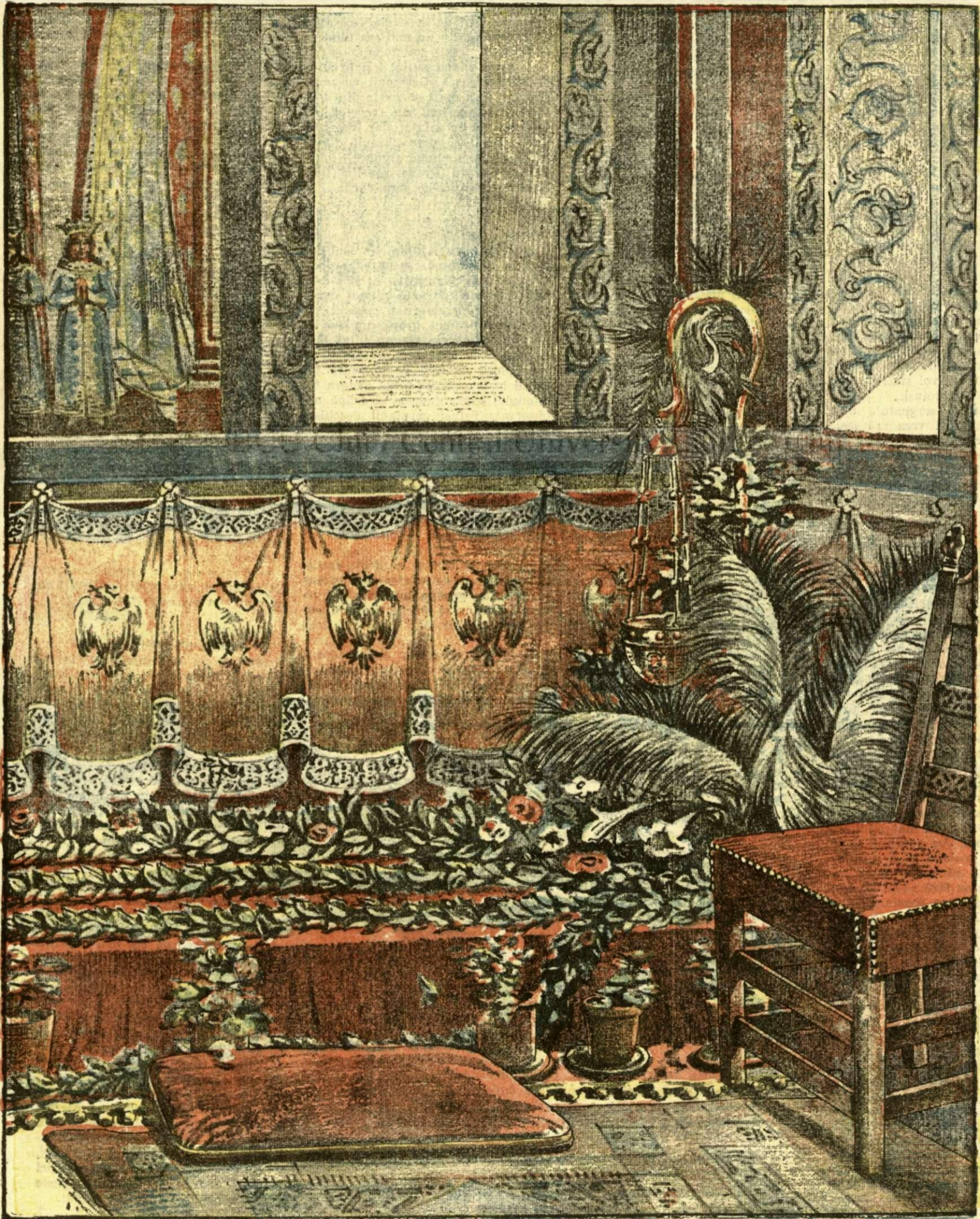
Mormântul Regelui Carol. — (Vezi explicația)

ANUNCIURI Linia pe pagina 7 și 8 — BANI 20 —