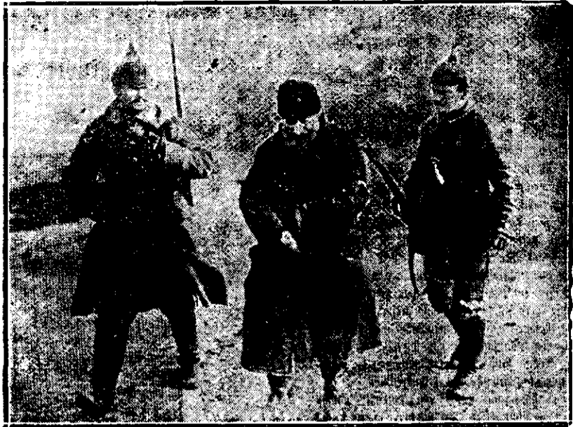
Spion dus între baionete

El a rămas toată viața lui un suflet neprihănit de țaran, robust și sănătos, un locuitor al muntelui. Toată lumea lui ideală, toate visurile, toate aspirațiile lui sunt azvâr-