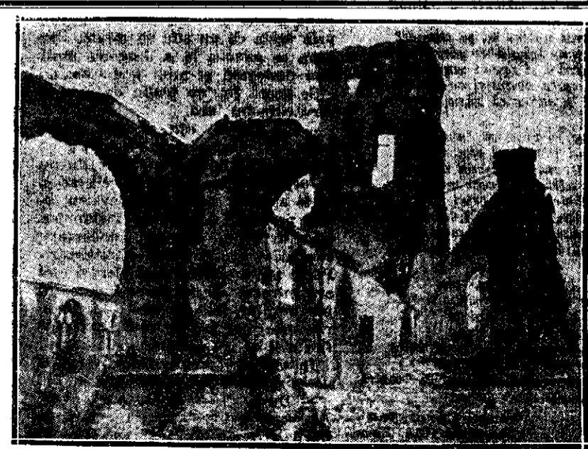
Ce a ramas din biserica din Pervyse (Belgia)