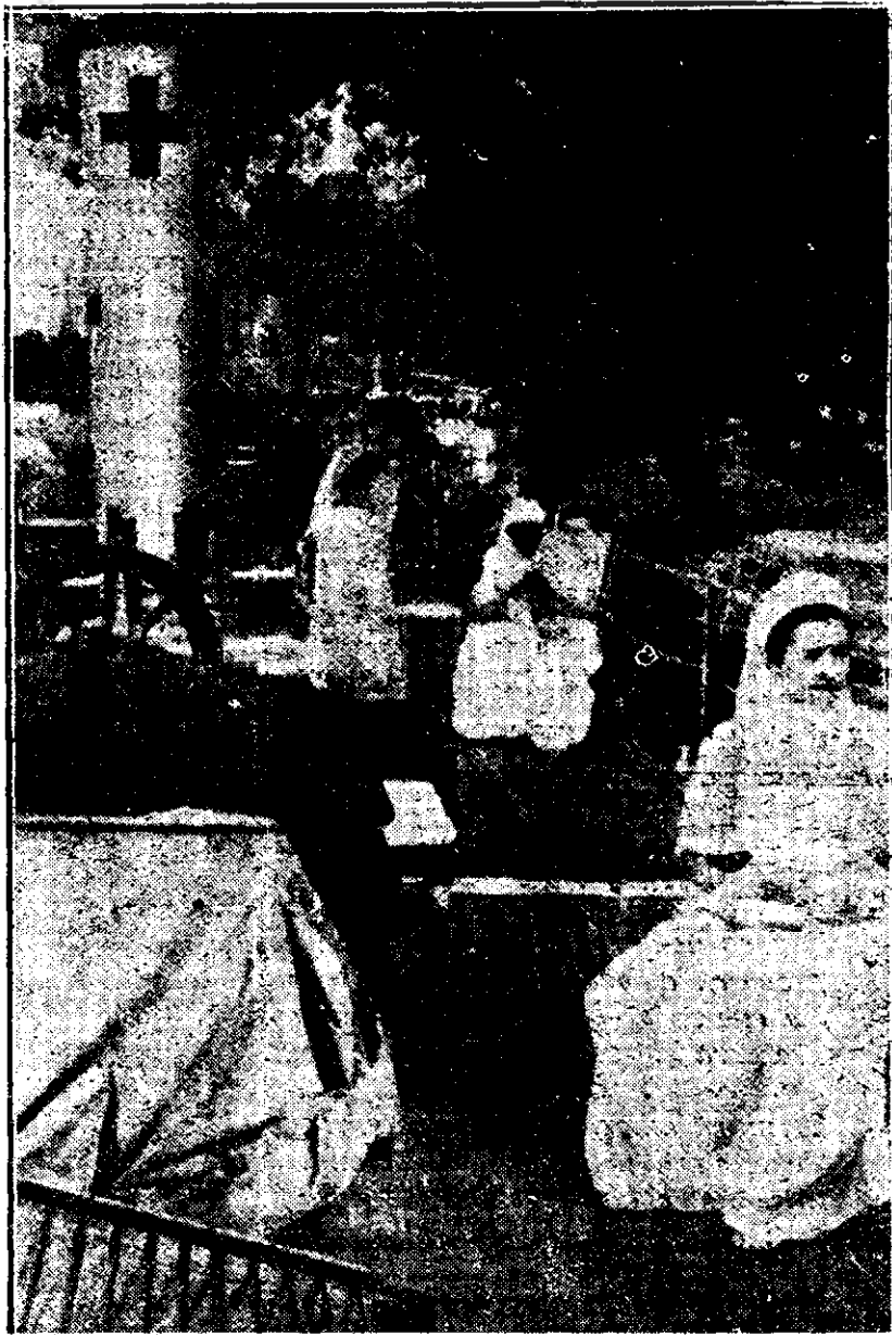
Vapor de plăcere transformat în vas-spital, pentru transportul răniților francezi.