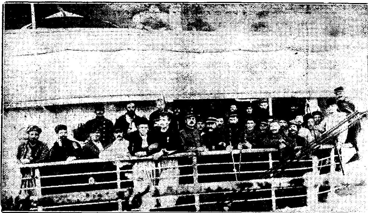
Răniți francezi îngrijiți la Beaurdeaux pe bordul vaporului „Gascogne“.