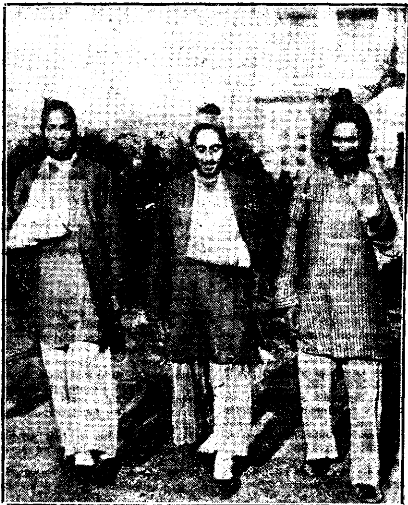
SOLDAȚI INDIENI RANIȚI

Ce giugășie și ce cunoștință a tei de a serie e în acest vers: Ah! amintirile-s ca fulgii rămăși uitați în cuiburi goale