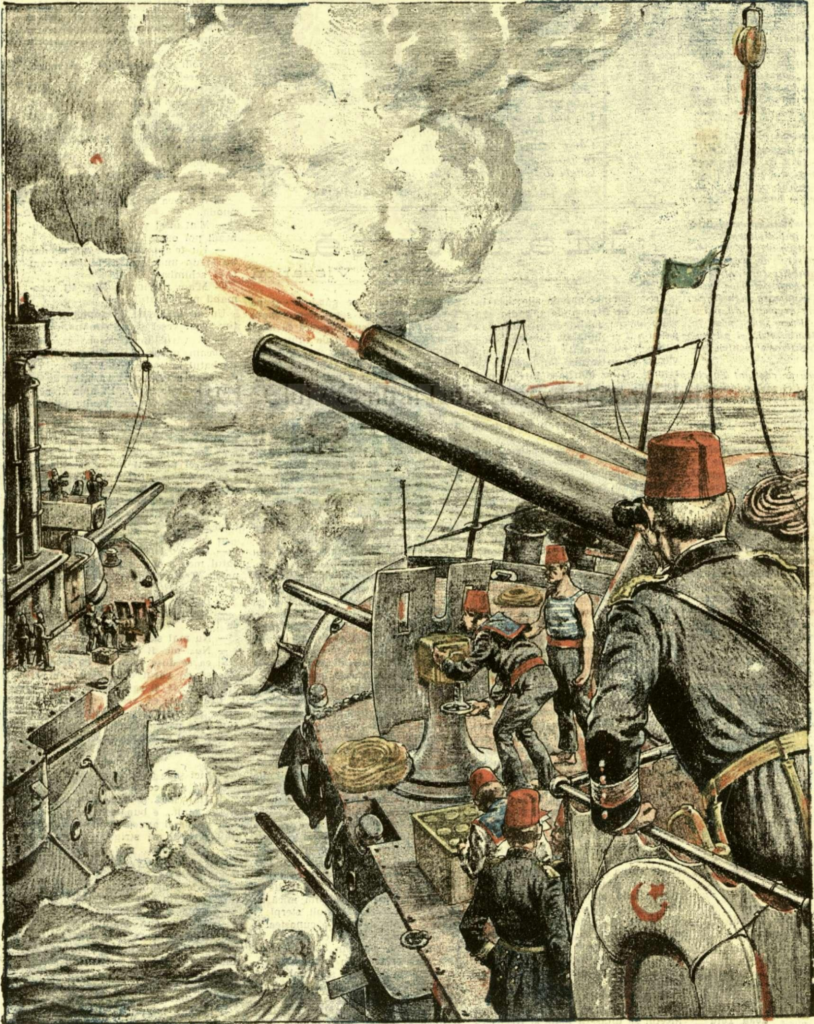
Flota turcă bombardând coastele rusești pe Marea Neagră

ANUNCIURI Linia pe pagina 7 și 8 - BANI 20 -