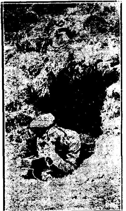
Telefonul în campanie