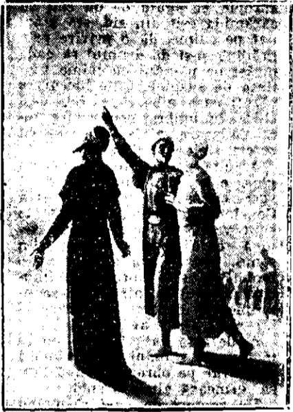
Magii ducându-se spre Betleem

Trăsura noastră merge urcând, prin mijlocul grădinilor de măslini, coasta unui deal în culmea căruia se află hanul bunului Samaritan. Pe aci se află și mormântul grecesc St. Elie.