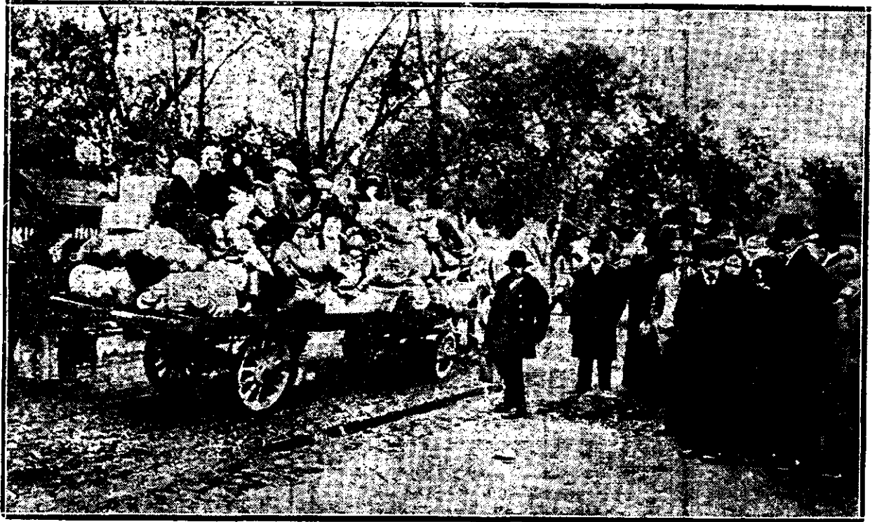
Femeile și copiii fugind de inamicul ce se apropie.