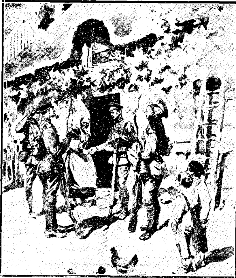
Soldatii englezi într'un sat francezesc

— Aici stau eu... Uite-mi copiii!... Sfârșitul în numărat viitor.