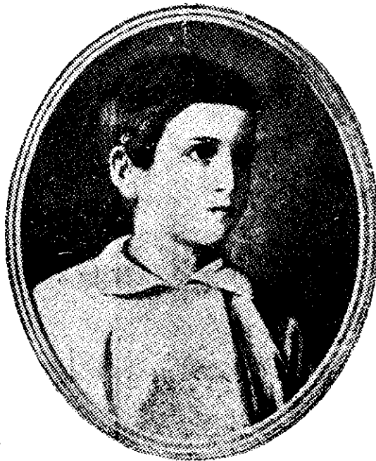
Regele Carol ca școiar