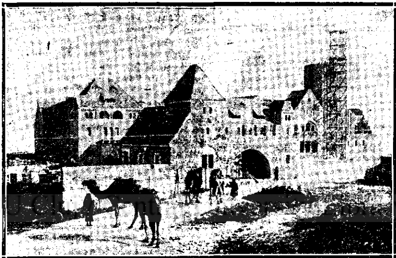
Fundațiunea Impărătesei Augusta-Victoria

De pe Muntele Măslinilor, Ierusalimul, cuprins între zidurile sale, se vede ca în palmă și i se pot distinge foarte ușor toate drumurile și toate edificiile. Dar edificiul cel mai apropiat,