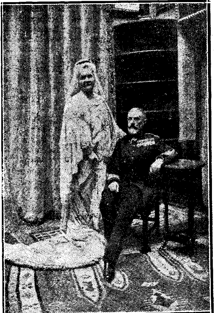
MM. LL. Regele și Regina după o fotografie recentă

„Nichifore, du-te dracului, are să te taie turcii, și am să scap de tine”.