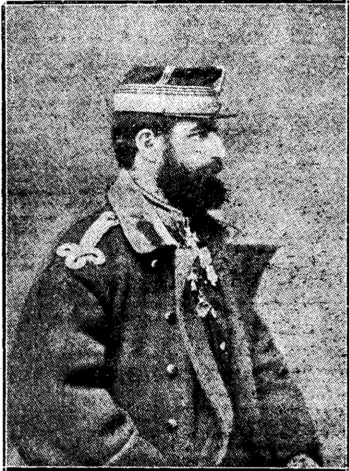
Regele Carol I în 1877