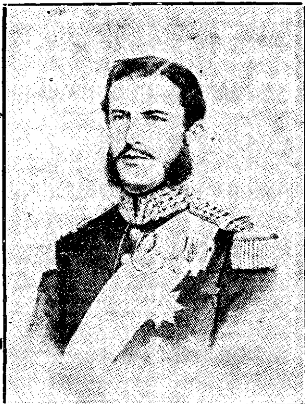
Domnitorul Carol I in 1866