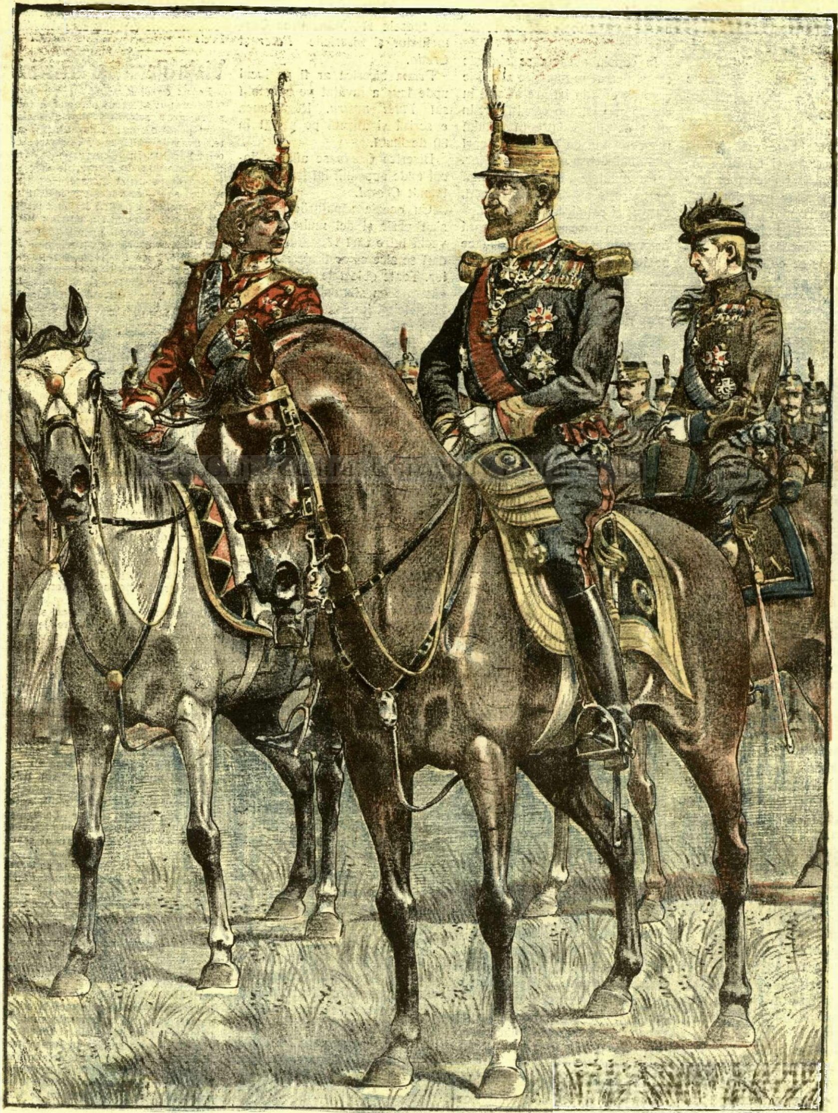
M.M. L.L. Regele Ferdinand I si Regina Maria