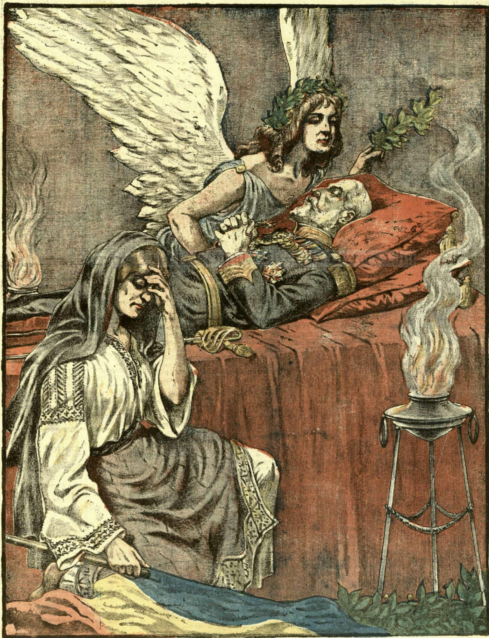
Regele Carol I pe patul de moarte