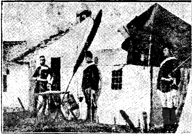
Regele Carol la Poradin