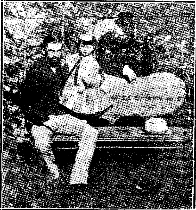
Domnitorul Carol cu Doamna Elisabeta și Principesa Maria, fiica Suveranului