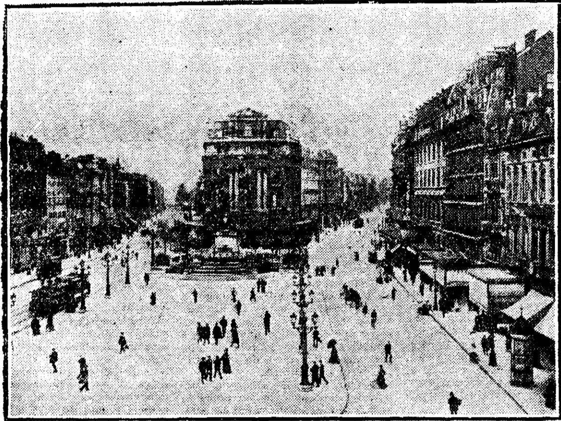
BRUXELLES: — Piața principală

E foarte greu să apreciezi opera unui Lemaitre în câteva rânduri. A fost un spirit eminent francez și galic. Pătrundea repede lucrurile, avea intuiția clară și plastică a artistului și poseda o formă impecabilă. Învățase mult, trăise mult,