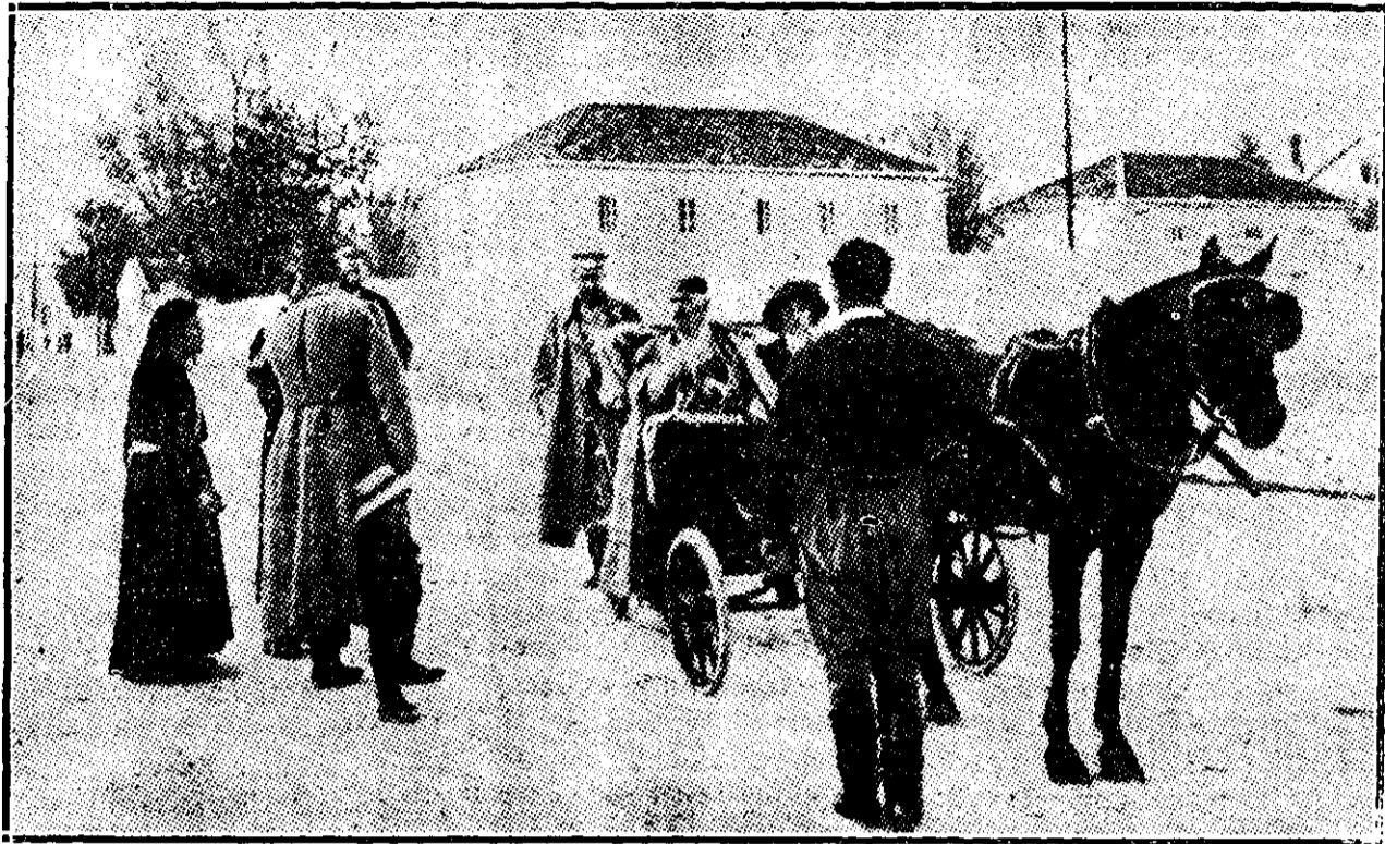
Regele Nichita al Muntenegrului primește în stradă petiția unei văduve