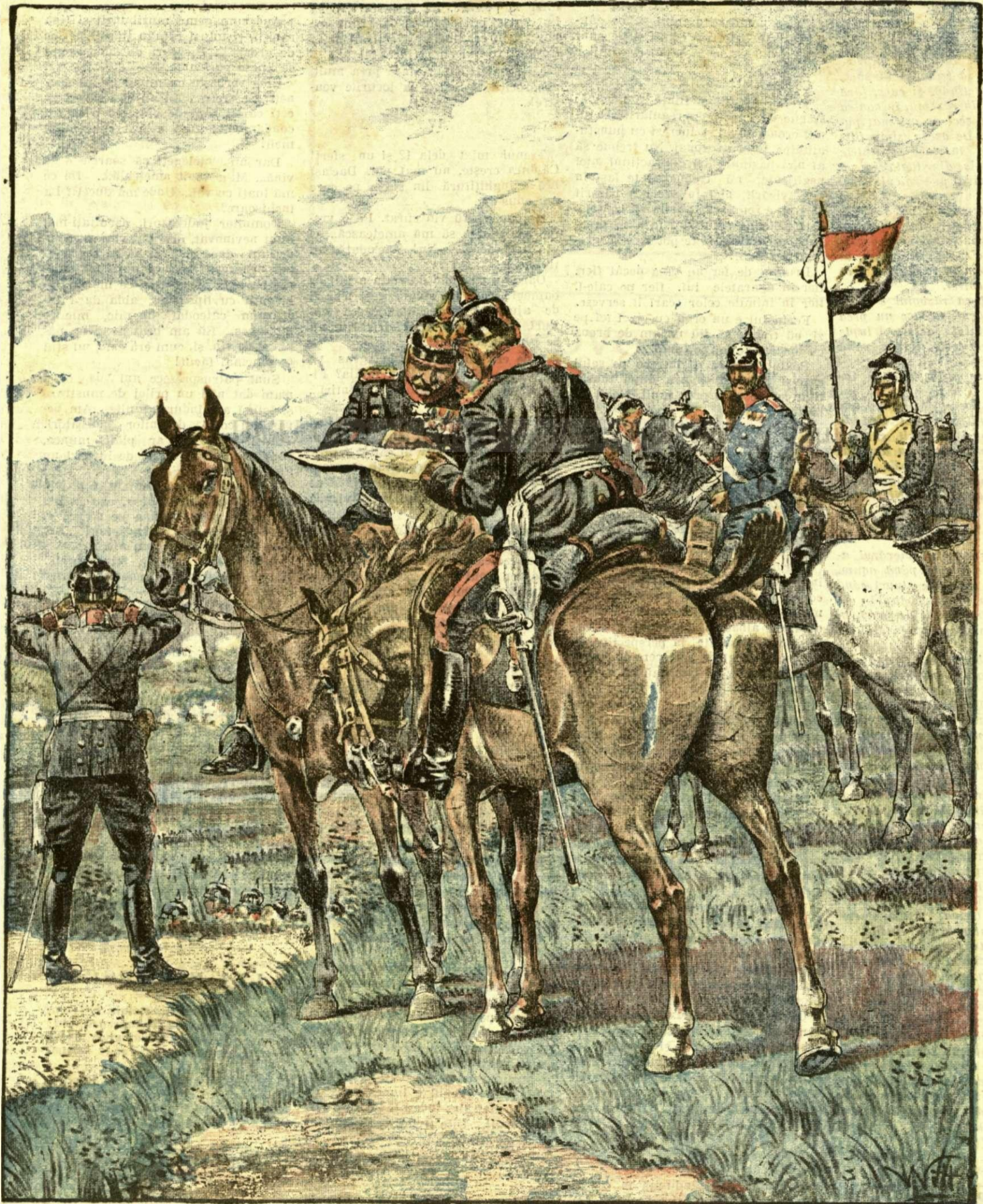
Armata germană în fața orașului Liège

ANUNCIURI Linia pe pagina 7 și 8 — BANI 20 —