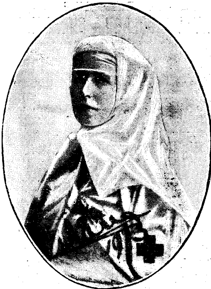
A. S. R. Principesa Maria, ca sora de caritate