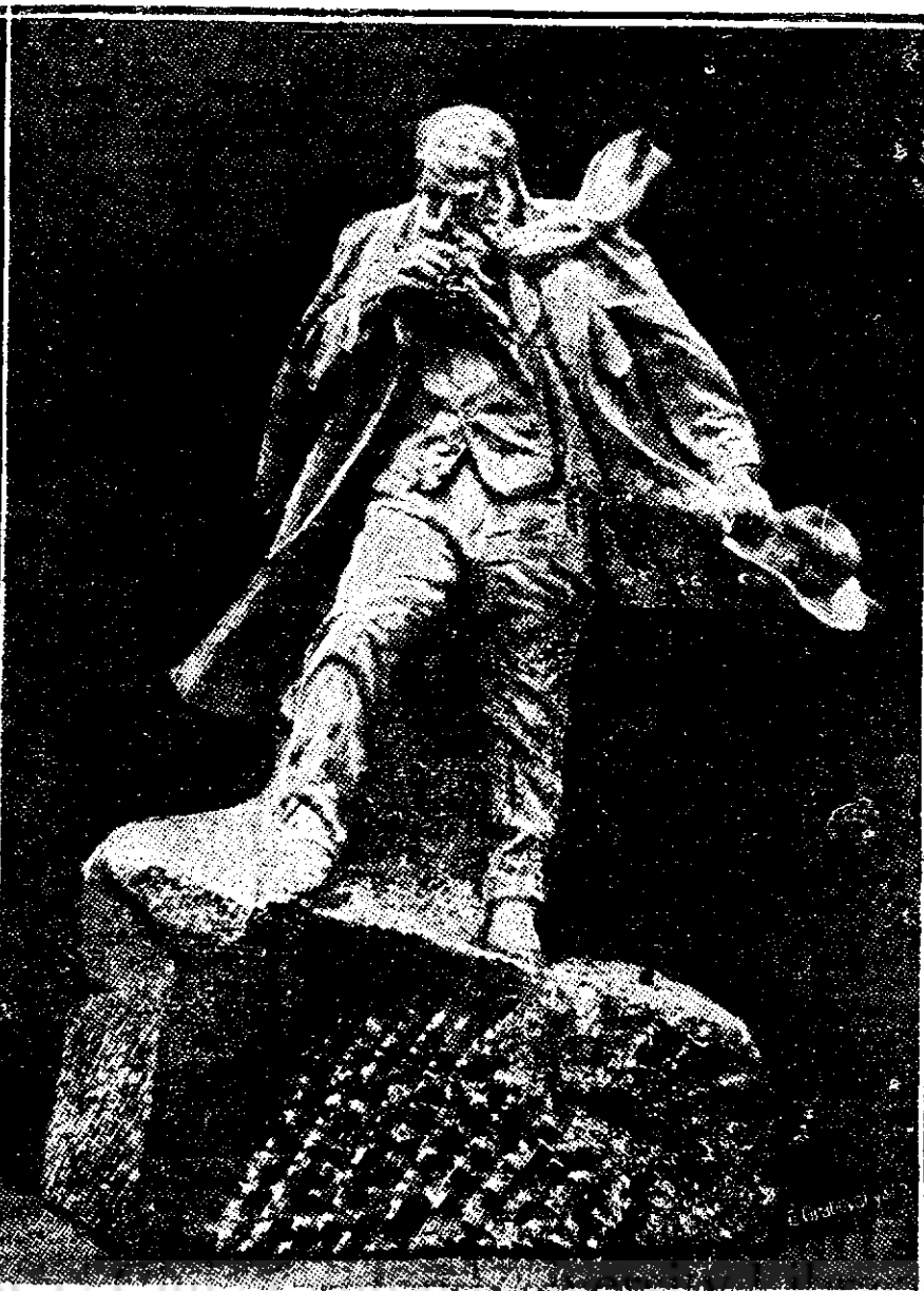
Statuia în granit, de Jean Boucher ce urmează a se inaugura în curând, în parcul Candie din portul Saint-Pierre.

Într-o seară, când tocmai familia Zăuceanu se rânduia în jurul mesei îmbelșugată, sbârâni deodată soneria.