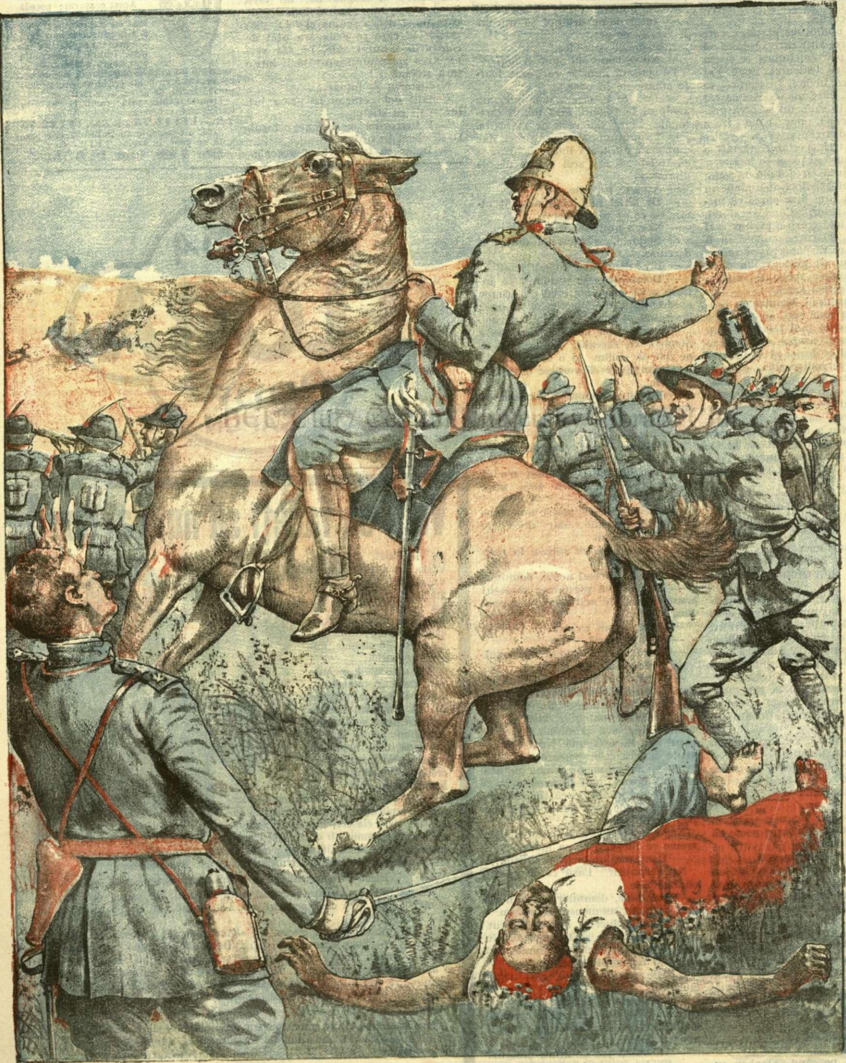
MOARTEA UNUI VITEAZ. - (Vezi explicația)

ANUNCIURI Linia pe pagina 7 și 8 — BANI 20 —