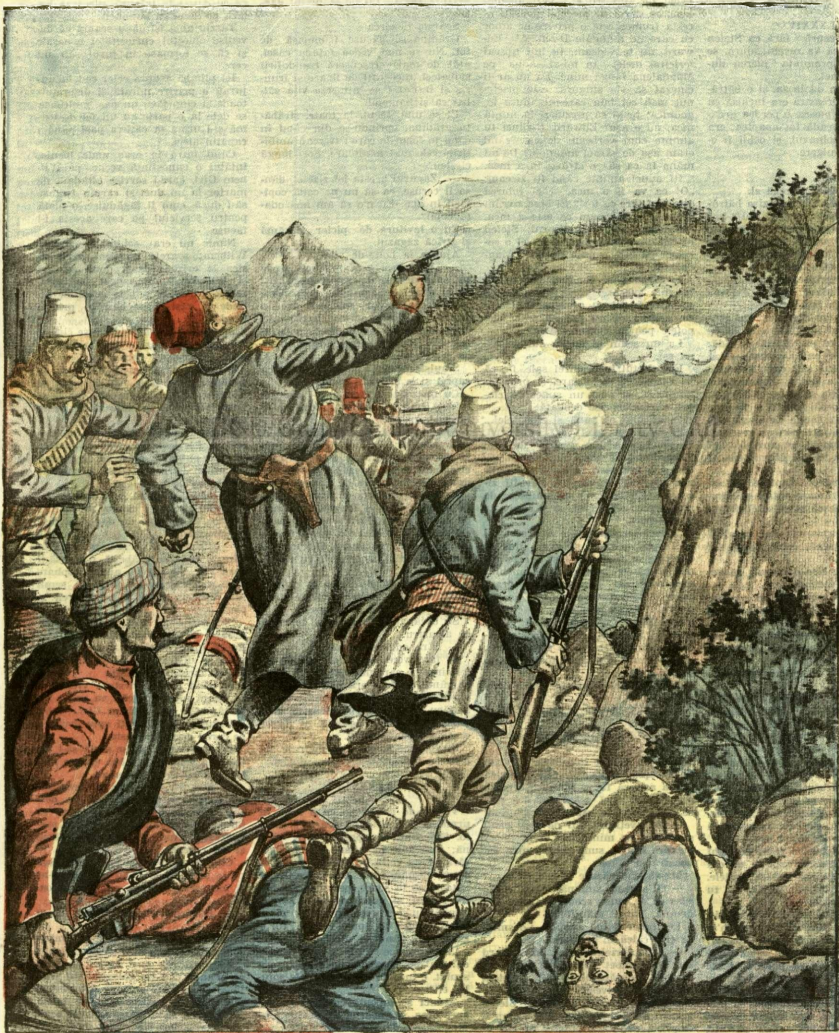
TURBURĂRILE DIN ALBANIA