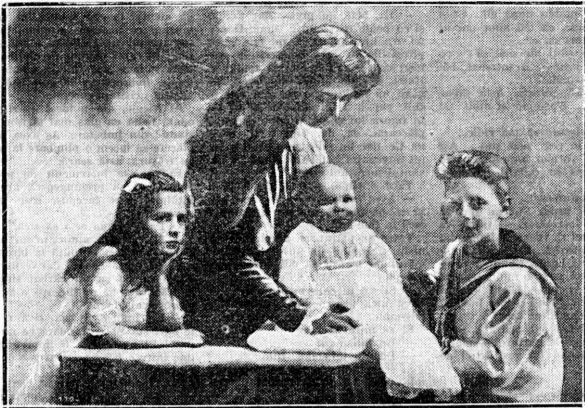
Micul principe Mircea înconjurat de principesela Elena, Mariaoa și de prințul Nicolae