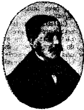
Principele Hermann de Wied

Regina Elisabeta e adorată în țara ei. Nu-i ființă omenească în țara aceasta care să nu aibă o nețărmurită și sinceră iubire pentru această Regină făurită din bunătate, geniu, abnegație, devotament și din toate calitățile fără de preț