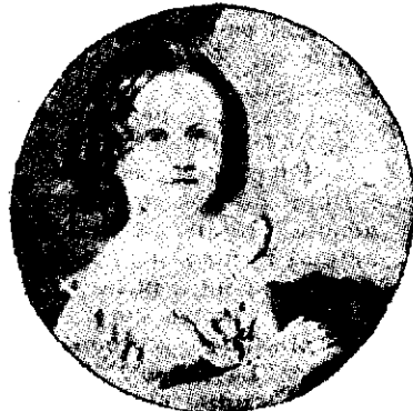
Regina Elisabeta ca copilă