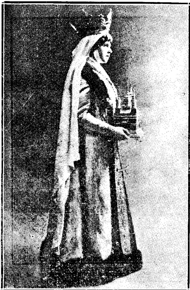
A. S. R. Principesa Maria în costum de Dama din vremea lui Carol al II-lea