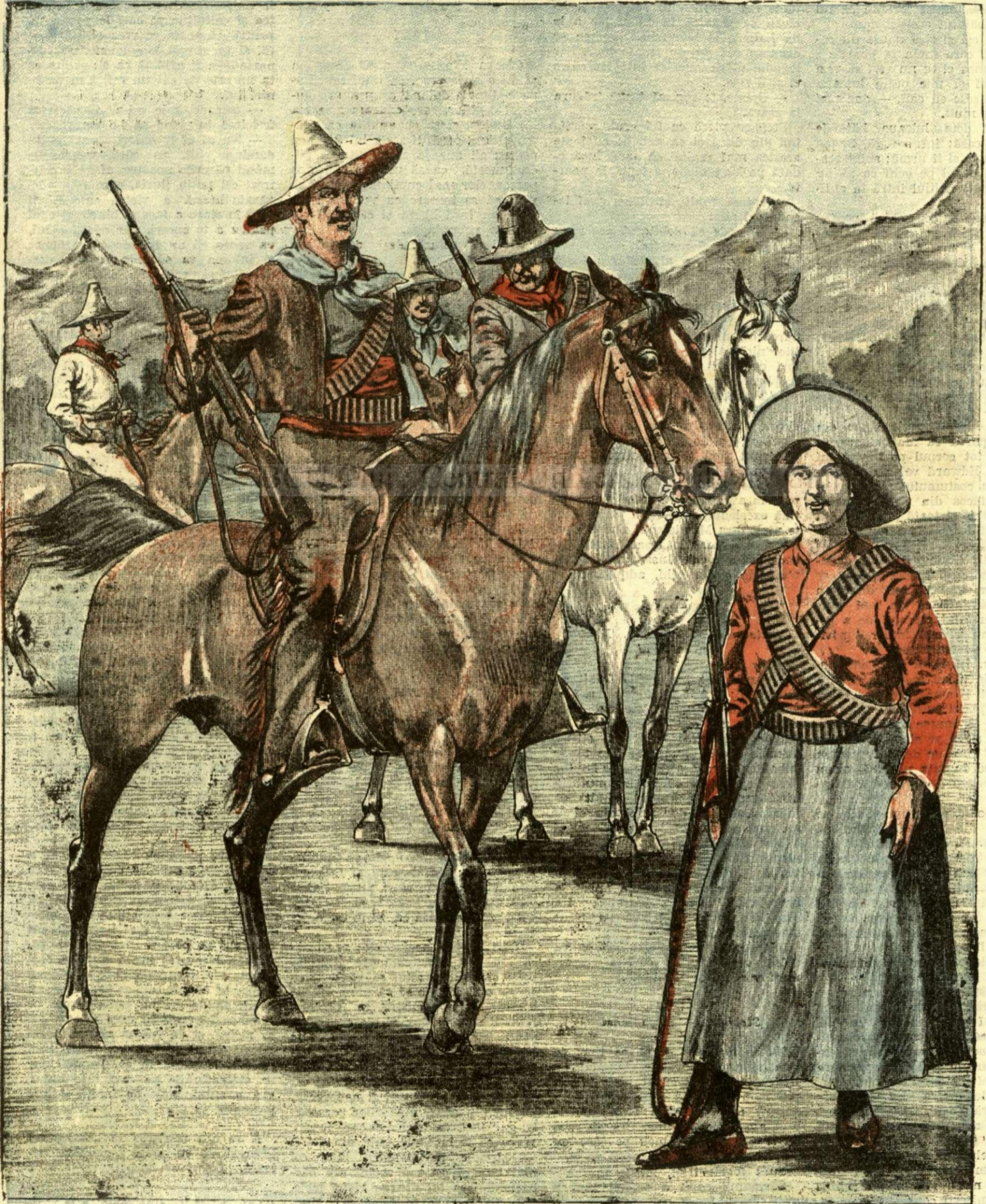
REVOLUȚIA DIN MEXIC

ANUNCIURI Linia pe pagina 7 și 8 — BANI 20 —