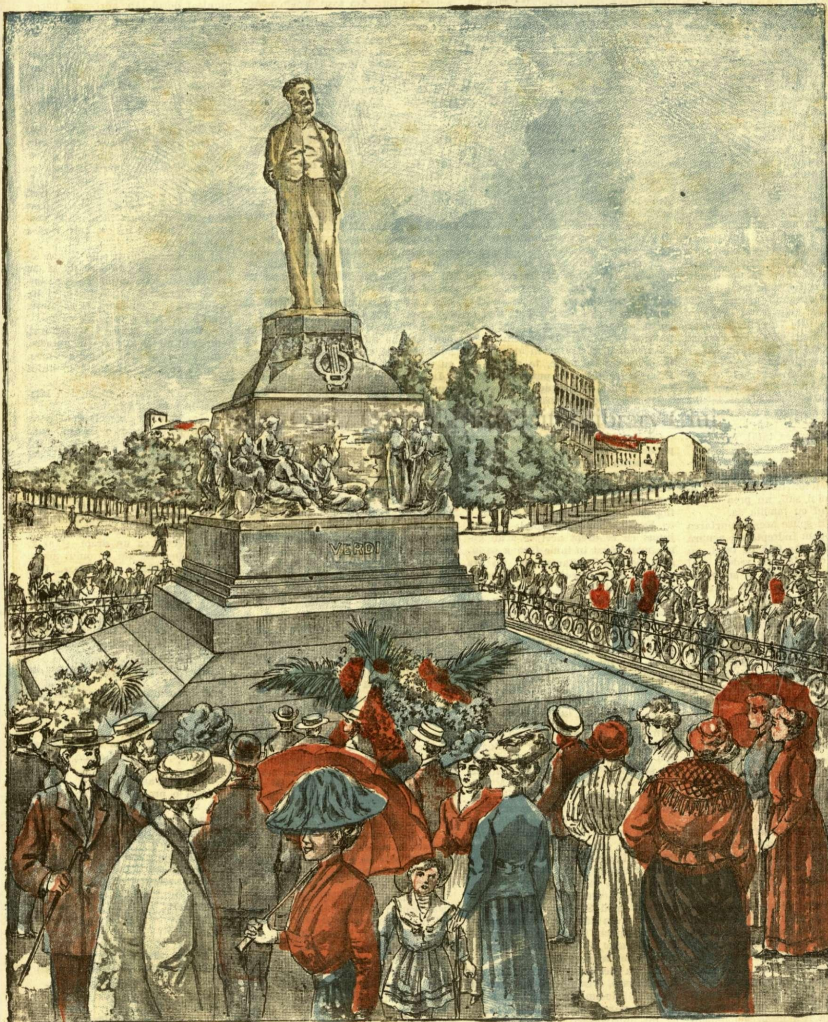
MONUMENTUL LUI VERDI LA MILANO