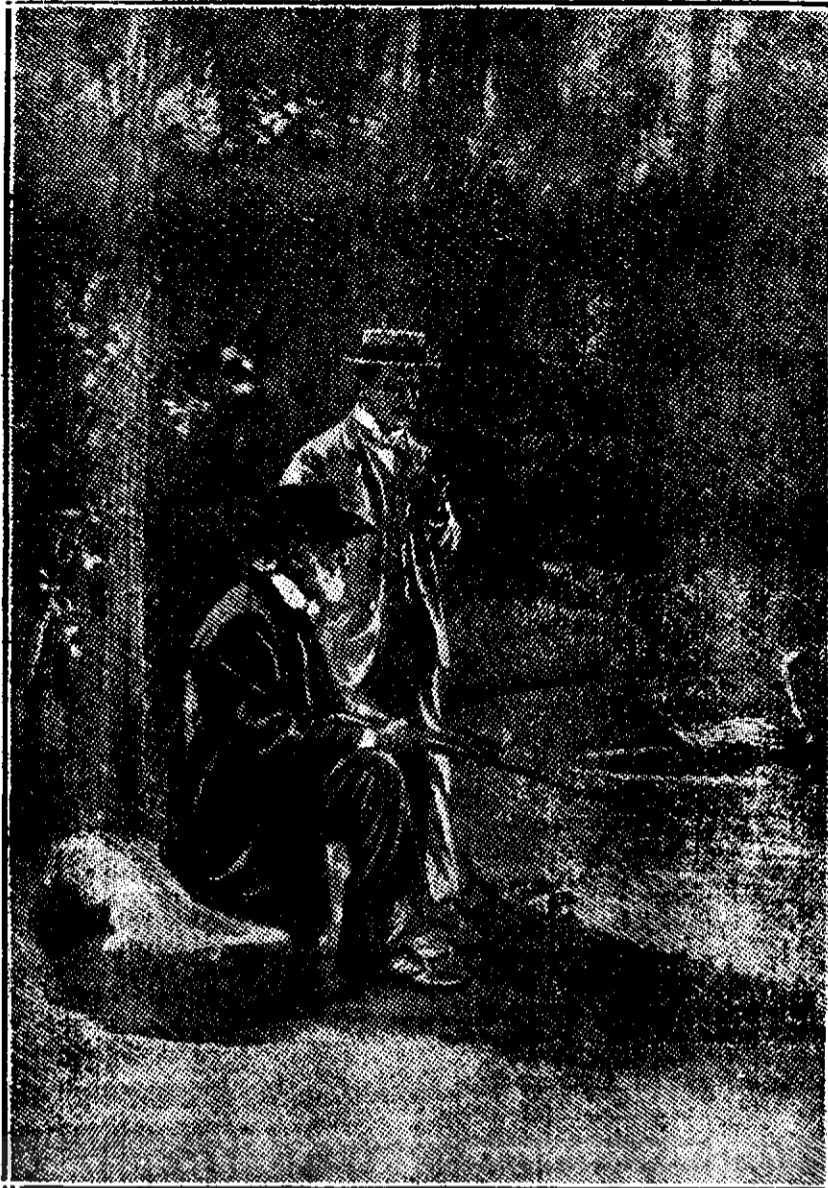
Giuseppe Verdi în grădina vilei sale Sant'Agata

Italia e în sărbătoare. La 10 Octombrie stil nou a. c. a celebrat împlinirea a o sută de ani de la nașterea lui Giuseppe Verdi.